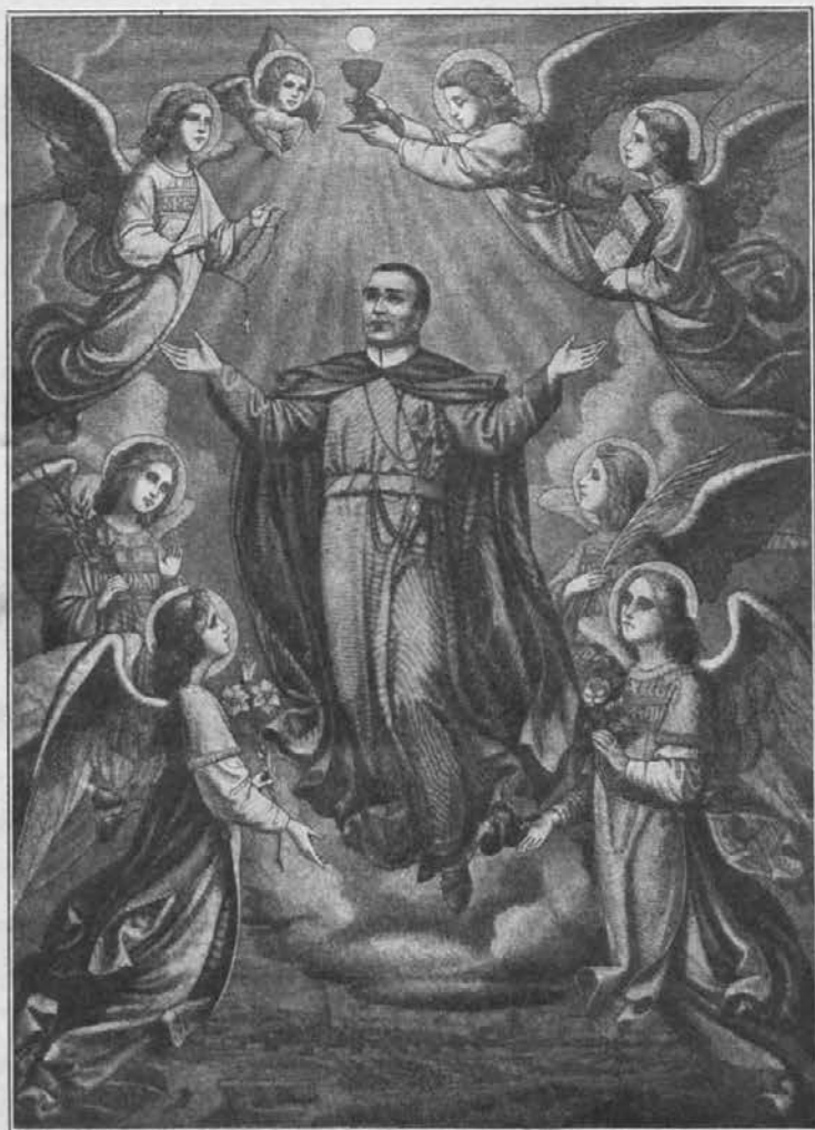
SV. KLEMEN MARIJA DVORAK Apostol Dunaja iz reda Redemptoristov

upati, ampak sklepati, da ga pri tem vodi le njegova lastna ljubezen in korist, ali pa sovraštvo in nevoščljivost in skuša kaki dobri stvari le škodovati.