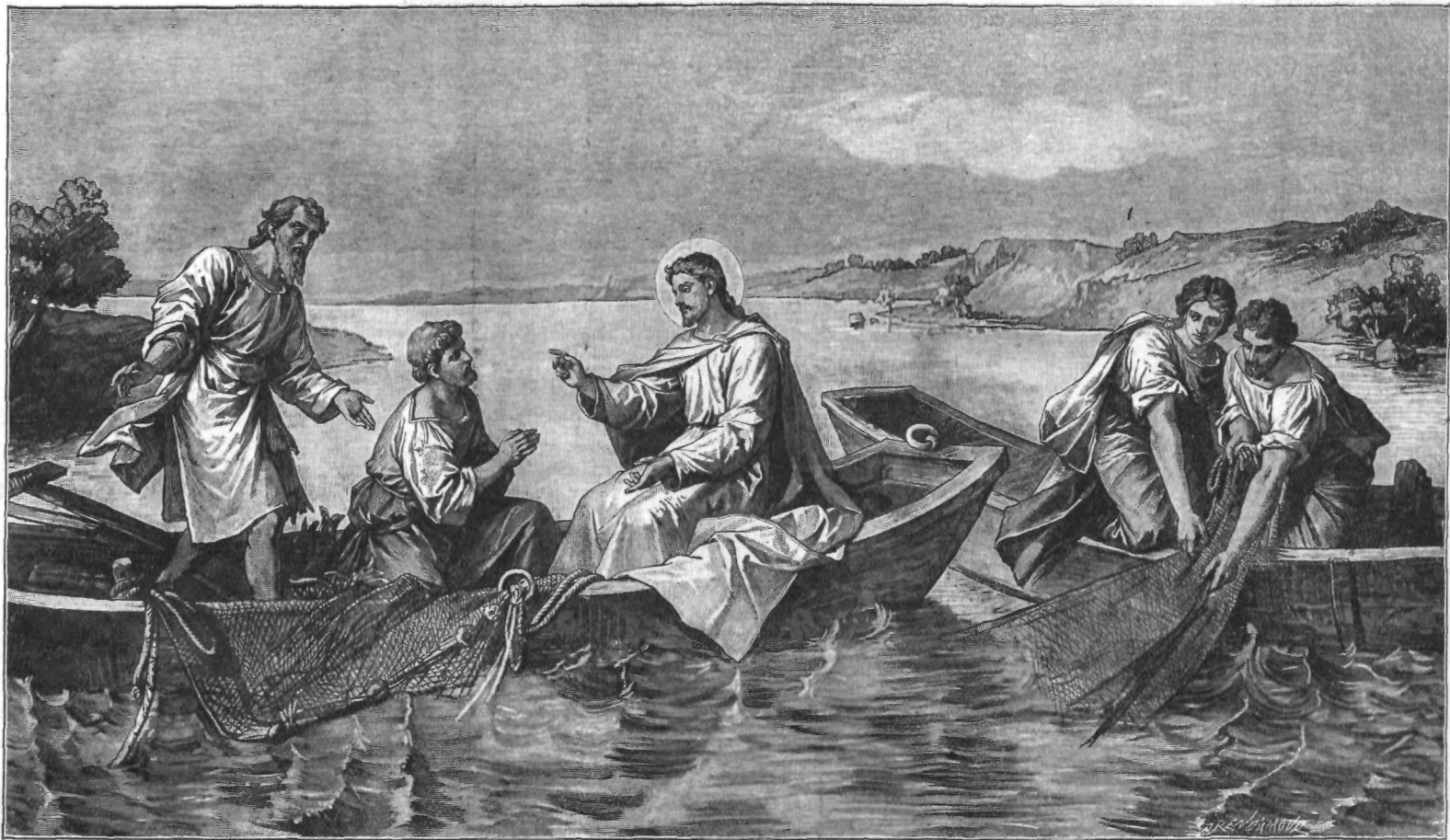
Čudežno pomnoženi ribji lov.