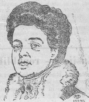
Königin Elenore von Bulgarien †.

Umrla je soproga poštenega našega zaveznika bolgarskega kralja Ferdinanda. Pokojnica je bila velikodušna kraljica in blaga žena. Na strani svojega kraljevskega vladarja, ki nam je zvesti prijatelj in zaveznik, preživela je težke čase prve in druge balkanske vojne. Doživela pa ni konečne zmage, ki boče tudi bolgarskemu kralju prinesla mogočno bodočnost. Umrla kraljica Eleonora pa je bila tudi prava mati svoji državi. Zato joka ob njeni gomili ves bolgarski narod, pa tudi mi zavezniki čutimo vso pretresljivo žalost te prerane smrti.