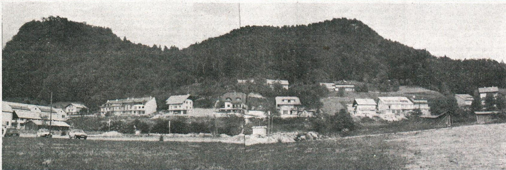
Novi trg: osem stanovanjskih blokov za trg ali turistično-rekreacijsko območje?

SEKRETARIAT ZA UREJANJE PROSTORA IN VARSTVO OKOLJA meni, da bo usklajene interese v prostoru možno doseči z javno razgrnitvijo in javno obravnavo osnutka zazidalnega načrta. Po njegovem mnenju so v idejnem projektu v veliki meri izhodišča glavnih