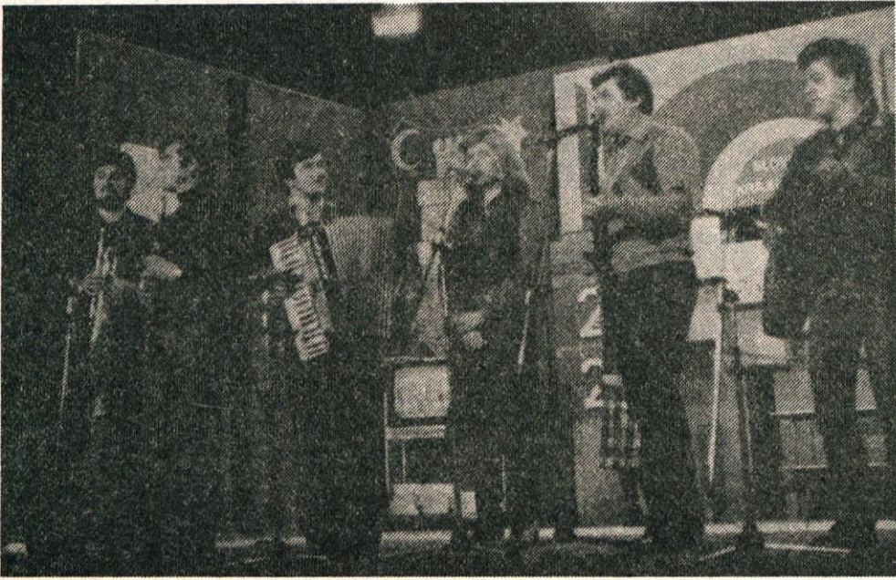
Ansambel Poljanšek s pevcema in s svojo kamniško skladbo je za nekaj časa dvignil razpoloženje v dvorani. Novo skladbo so napisali, uglasbili in se je naučili natanko v enem tednu.