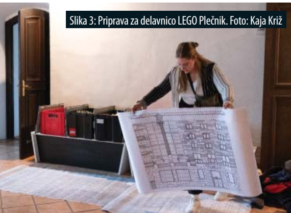
Slika 3: Priprava za delavnico LEGO Plečnik.