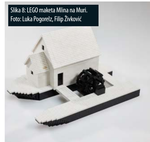
Slika 8: LEGO maketa Mlina na Muri.