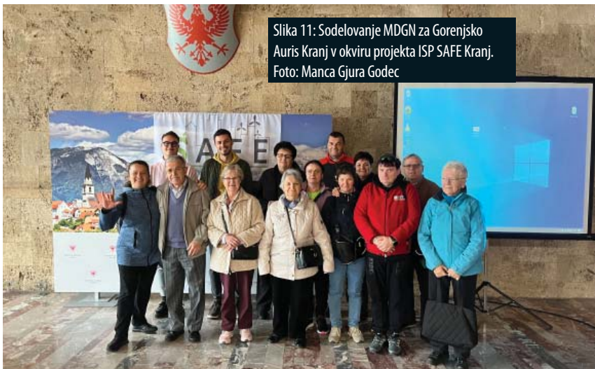
Slika 11: Sodelovanje MDGN za Gorenjsko Auris Kranj v okviru projekta ISP SAFE Kranj.