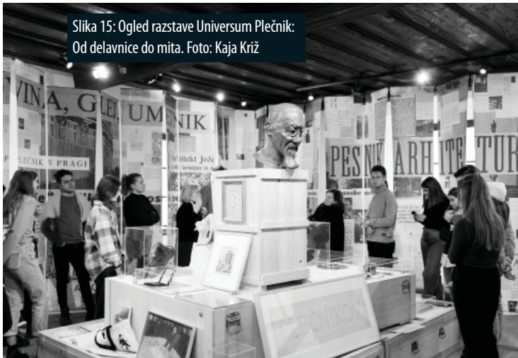
Slika 15: Ogled razstave Univerzum Plečnik: Od delavnice do mita.