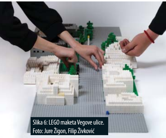
Slika 6: LEGO maketa Vegove ulice.