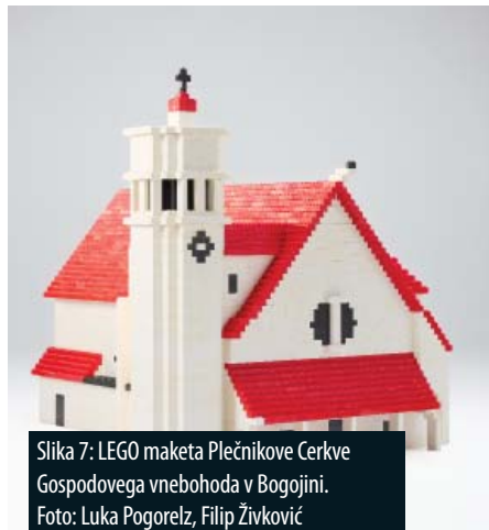
Slika 7: LEGO maketa Plečnikove Cerkve Gospodovega vnebohoda v Bogojini.