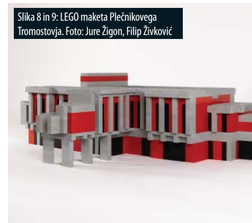
Slika 8 in 9: LEGO maketa Plečnikovega Tromostovja.

The finalisation of the journal at the end of the year is an excellent process that demonstrates the year-round effort to find research activities that, in light of their implementation, meet again and again with the creative spirit of the authors. Indeed, all the topics discussed and presented show a remarkable degree of originality in the conduct of thorough research, the study of theory, the application to student workshops, and a range of other activities that prove necessary when taking into consideration the desire to develop the creative spirit.