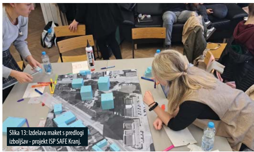
Slika 13: Izdelava maket s predlogi izboljšav - projekt ISP SAFE Kranj.

služile kot konceptualna podlaga graditeljem Rupnikove črte, nudijo skozi izkustvenost prostora pravi vpogled v preteklost ter podlago za razmislek o vlogi teh monolitnih in mogočnih utrdb v sodobnem prostoru.