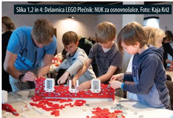
Slika 1,2 in 4: Delavnica LEGO Plečnik: NUK za osnovnošolce.