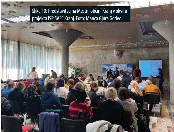
Slika 10: Predstavitve na Mestni občini Kranj v okviru projekta ISP SAFE Kranj.