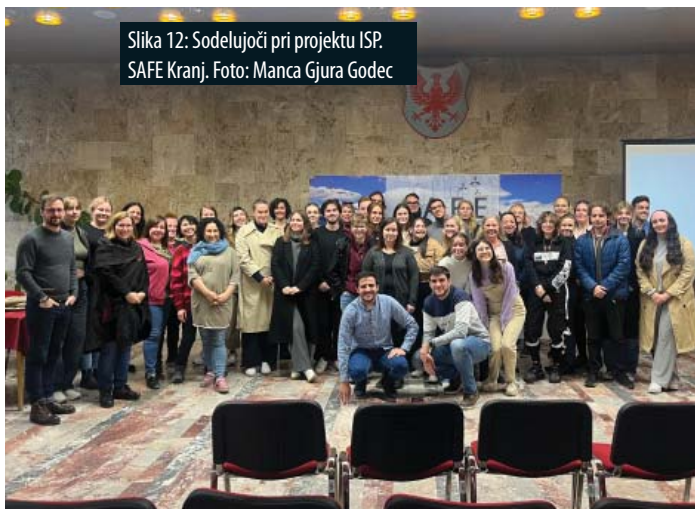
Slika 12: Sodelujoči pri projektu ISP SAFE Kranj.