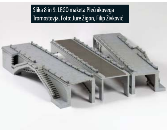
Slika 8 in 9: LEGO maketa Plečnikovega Tromostovja.