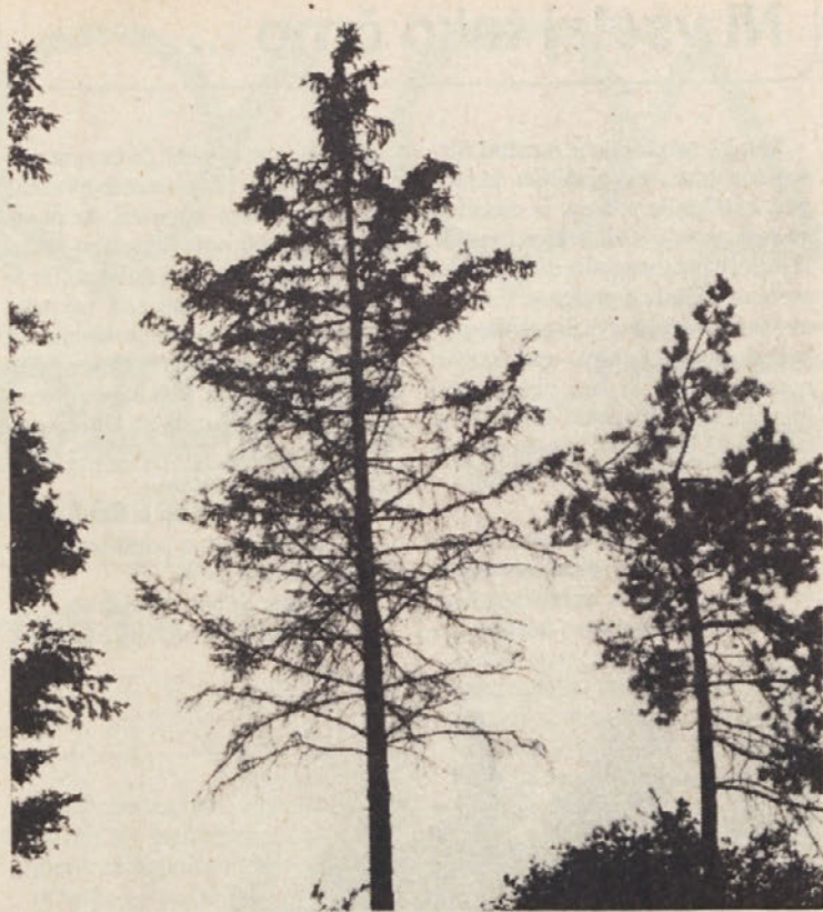
To ravno ne, ampak...