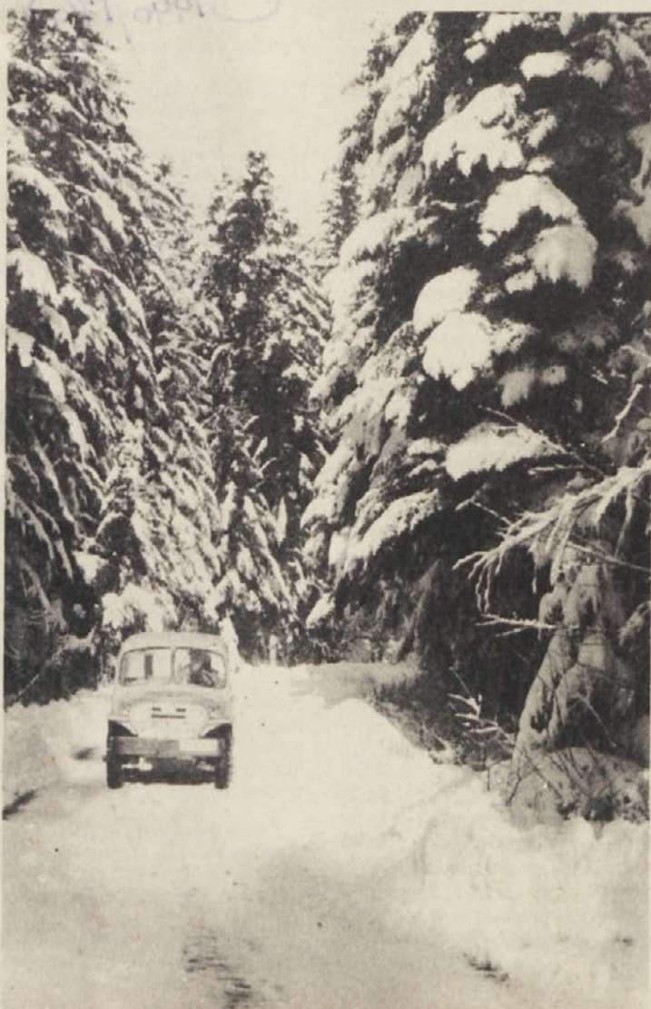
Spomin na eno prejšnjih zim.

Ob koncu se je direktor Petrič zahvalil vsem, ki so slavili obletnico zves-