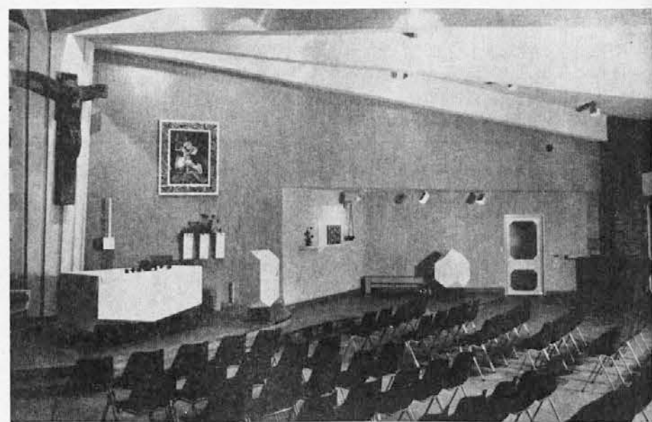
Notranjost slovenske cerkve Marije Pomagaj v Buenos Airesu

Poleg Slovenske hiše je v Argentini še osem krajevnih domov ter dva vzgojna zavoda: Rožmanov v Adrogué in Baragov v Lanusu. V krajevnih domovih so ljudskošolski tečajji s poukom slovensčine, zgodovine, slovenskega zemljepisa in deloma tudi telovadbe. V vsakem središču je tudi krajevni pevski zbor, poleg njih