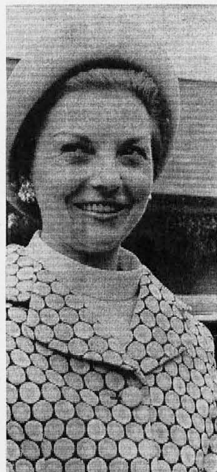
María Estela Martínez ali »Isabelita«, vdova po pok. generalu Peronu in časasna predsednica Argentine. Morda ji bo uspelo s simpatičnim nasmehom pridobiti argentinsko ljudstvo; v tem primeru bo poleg Indire Ghandi in Golde Meir tretja ženska, ki vodi državo.

Ukrajinski učenjak nadaljuje gladovno stavko Našim bralcem je znano, da sovjetska Rusija uganja močno nacionalistično politiko na škodo vseh neruskih narodov v državi. Med temi so zlasti Ukrajinci, ki se jih Moskva najbolj boji, ker jih je 40 milijonov in so industrijsko najbolj razvita republika. Zato je že Stalin izvajal najhujše čistke prav v Ukrajini. Njegovi nasledniki v Kremlju nadaljujejo z njegovo politiko zatiranja ukrajinskega ljudstva in vsakega pojavnega ukrajinske samostojnosti tudi na kulturnem polju. Zato je veliko število ukrajinskih intelektualcev v zaporih in na prisilnem delu. Med temi je tudi slavni zgodovinar Valentin Moroz, ki je bil obsojen na 14 let ječe. Sedaj je Moroz začel z gladovno stavko, ki jo izvaja od 1. julija. Z njo želi doseči, da bi ga oblasti premestile iz ječe v kako delovno taborišče.