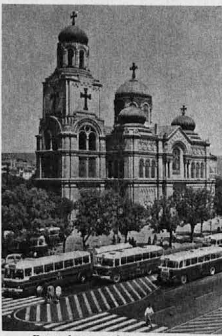
Pravoslavna stolnica v Varni

Od zadnje svetovne vojne se Varna naglo razvija. V njej je velik suhi dok za