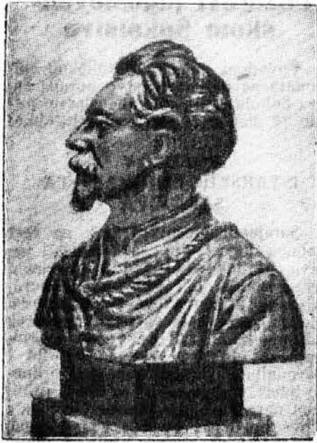
Tiršovo poprsje u Narodnom panteonu

Sto godina posle svoga rođenja i uskoro 50 godina posle svoje smrti stupio je Tirš među one besmrtno sirove češkoslovačkog naroda, koji su ga vodili kroz burno doba prošlog i sadašnjeg stoleća sve do njegovog oslobođenja, u galeriju narodnih velikana, u češki Panteon u Narodnom muzeju.