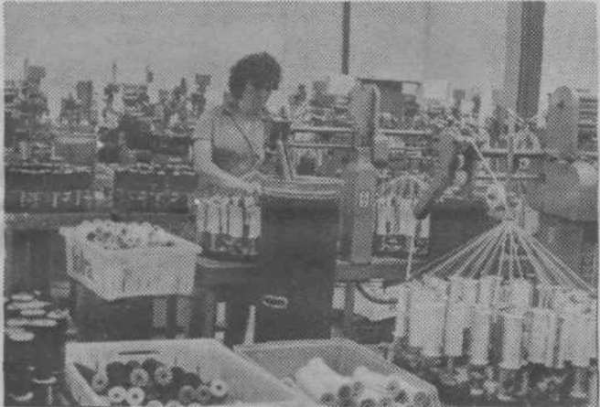
Detalj iz TOZD Pozamenterijskih izdelki

Med pripravami na proslavo naj omenimo športna tekmovanja, ki jih je pripravila komisija za sport in rekreacijo pri OOS Totre. Tekmovale so ekipe delovnih kolektivov KTM, Pletenina, Sava Kranj, milica Moste in se-