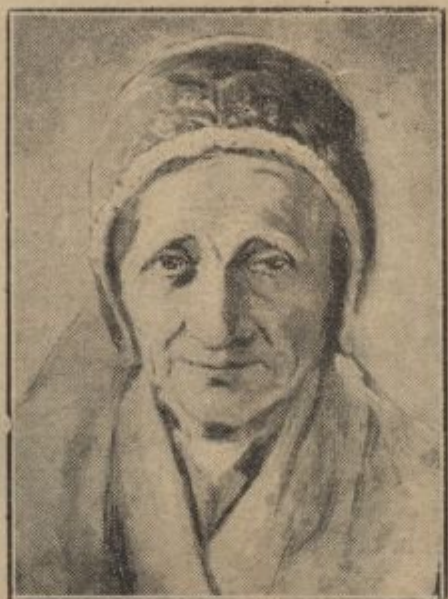
Groharjeva mati. Umetnikova slika, katero je povsod imel s seboj.