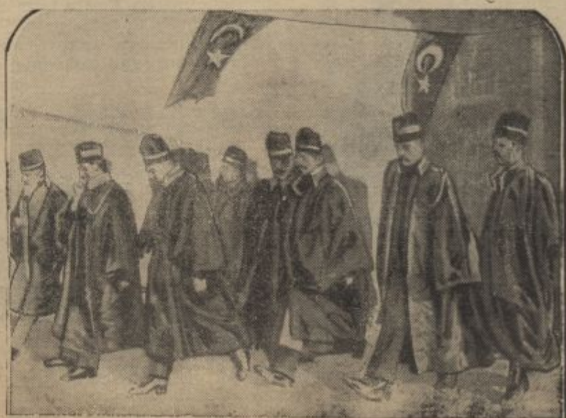
Turški zdravniki v svojih uniformah