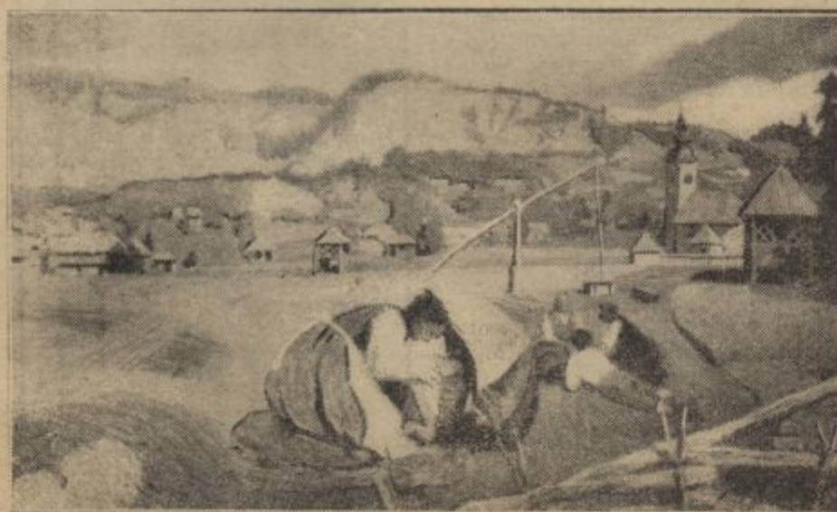
Počitek na polju na Koprivniku v Bohinju. Znamenito Groharjevo delo v Narodni galeriji v Ljubljani.