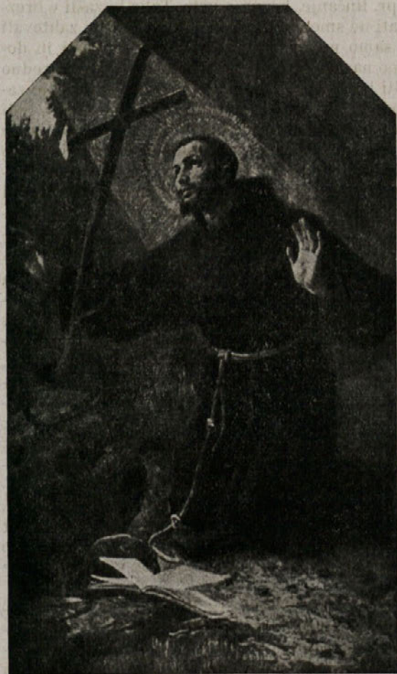
Sv. Frančišek prejme rane

Ozrmo se zdaj še na posamezne molitvene vaje svetega Frančiška. Predvsem pri tem ne smemo misliti, kakor da je njegova pobožnost obstojala v mnogih ali zapletenih pobožnostih. Njegova pobožnost je bila predvsem preprosto ponižna, otroška, blažena molitev in proslava enega in troedinega Boga. »Vedno moliti in gledati Gospoda, živega in pravega Boga,« to je imenoval vsebino molitvenega življenja. Treba je le pregledati starejše redovno vodilo, pa se lahko prepričamo, kako goreče je gojil pobožnost do presv. Trojice in jo priporočal svojim bratom.