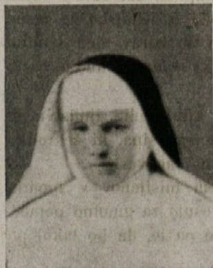
* 11. 5. 1918 v Žižkih pri D. Lendavi 31. 8. 1935 preoblečena 2. 12. 1936 odhod na Kitajsko 2. 9. 1939 večne obljube