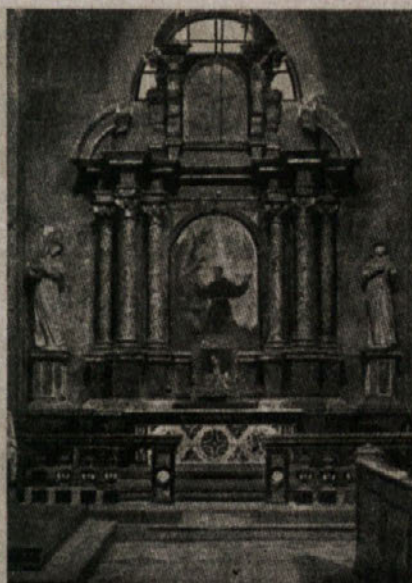
Stari oltar sv. Frančiška

Če se ozremo po cerkvi, imamo 6 kapel. Prva na desni je sv. Frančiška. Oltar je nov, delo Al. Vodnika. Starega so delno uporabili v Šiški. Slika je vtisnenje ran od Fr. Kunza. Kipa sta sv. Ludovik in sv. Elizabeta, od kiparja Zajca. Stene so okrašene z Wolfovimi freskami: smrt, poveličanje sv. Frančiška in porciunkula. V tej kapeli se prav primerno obhajajo prazniki sv. Frančiška.