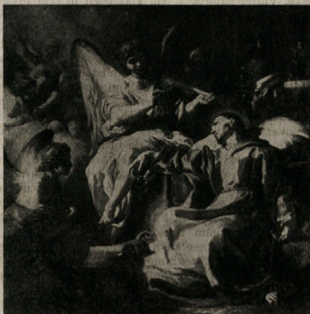
Angel svira umirajočemu Frančišku

Venec si večen, Frančišek, dobil doignjen v Očetovi slavi, ker si v življenju ves Sinu sledil s trnjevo krono na glavi.