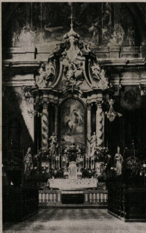
Robbov veliki oltar Marijinega Oznanjenja

Na veliki oltar se stavlja meseca majnika Šubičeva slika, oktobra Kastnerjeva, za osmino Imakulate pa p. Blaževa Mati-božja. Na stenah presbiterija so