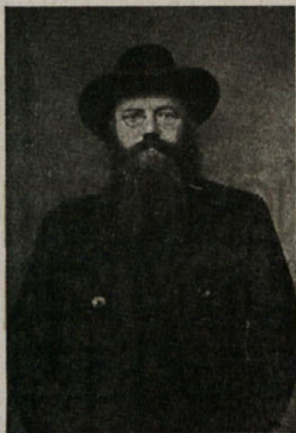
* 4. 6. 1872 na Studencu pri Krškem 17. 4. 1902 odšel na Kitajsko † 28. 2. 1928 v Jungčoufuju