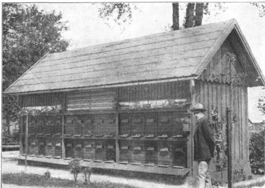
2. Čebelnjak gospoda Antona Rojine v Zg. Šiški h. št. 46.