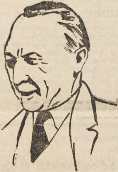
Nemški kancler Konrad Adenauer

Ker so na nekaterih pokrajinskih volitvah v teku zadnjega leta nemški socialdemokrati že osvojili večino, so izgledi največjih nasprotujočih si strank na zmago precej izenačeni in zato volilna kampanja, ki se je pravkar začela, obeta biti toliko bolj zanimiva.