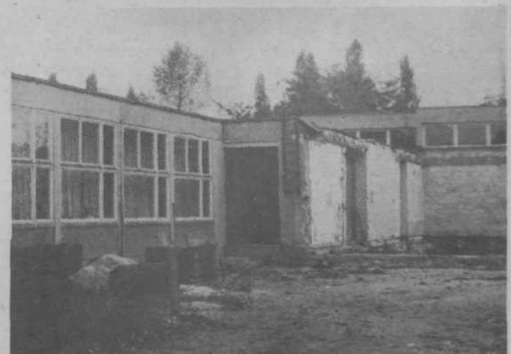
SANIRANJE VVZ ANGELCE OCEPEK – Najbolj poškodovani del stavbe je porušen – to je prva faza sanacijskih del na poškodovanem posloju vrtca Angelce Ocepek. V drugi fazi bodo popravili poškodovani obstoječi del stavbe z okrepitvijo temeljev, sten, centralnih sanitarij, inštalacij itd. Ta dela bodo končana do konca leta. Za tretjo fazo je v načrtu gradnja novega dela stavbe, ki je sedaj porušena. Pričetek del bo mogoč, ko bodo zagotovljena sredstva. Od 800 starih milijonov, kolikor bo stala celotna sanacija, manjka še 150 starih milijonov.

Zgrajeni objekti – Iz programa gradnje osnovnih šol od 1972 do 1974 je zgrajenih 6 šol