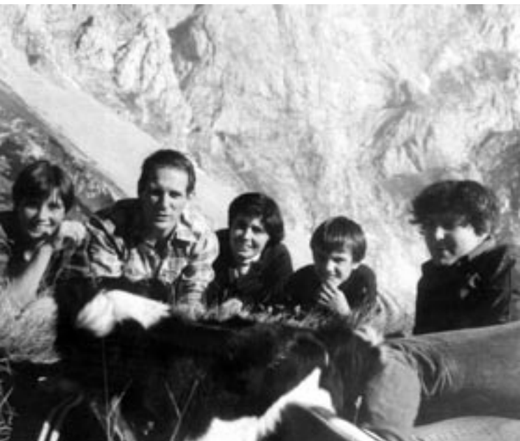
"Koliko imam lepih spominov, še za sto let ... in vsi so povezani s hribi".