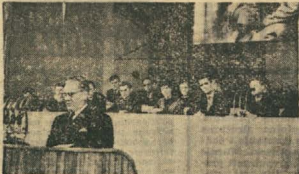
● Govor tov. Tita na VII. kongresu LMJ