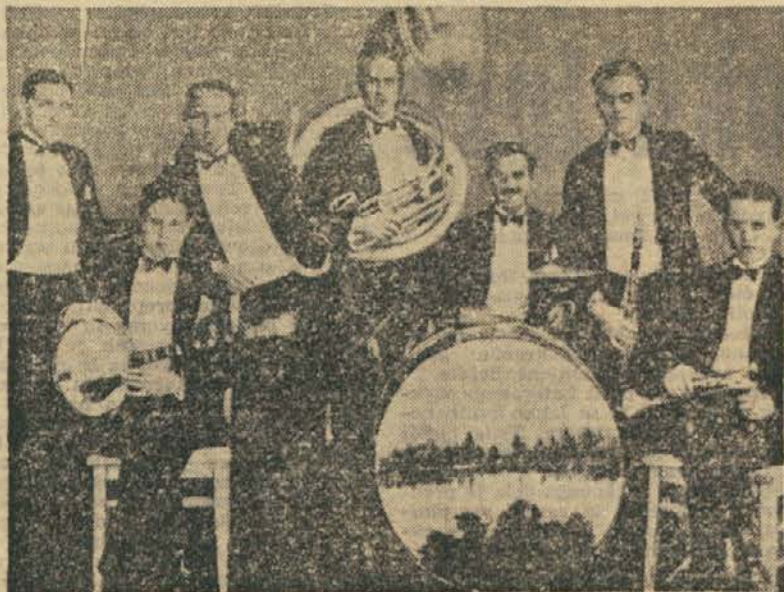
Iz tistih časov — trobentar BIX BEIDERBECKE (na sliki skrajno desni)