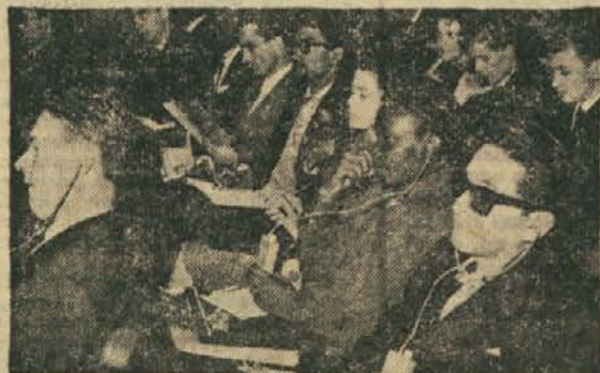
● Kongresu je prisostvovalo tudi mnogo tujih delegacij