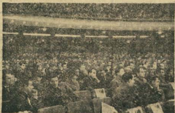
● Dvorana Doma sindikatov, v kateri je bil kongres

NOVA DELOVNA NALOGA: JADRANSKA MAGISTRALA