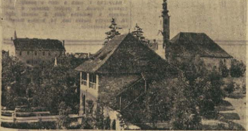
V starem delu mesta

Ko je prisedel Pero, sem izvedel, da je sedaj čas kriz. »Varteks« je v krizi. »Sloboda« je v krizi, premoaga ni, torej bo še šola v krizi itd. SLAVKO PUKL