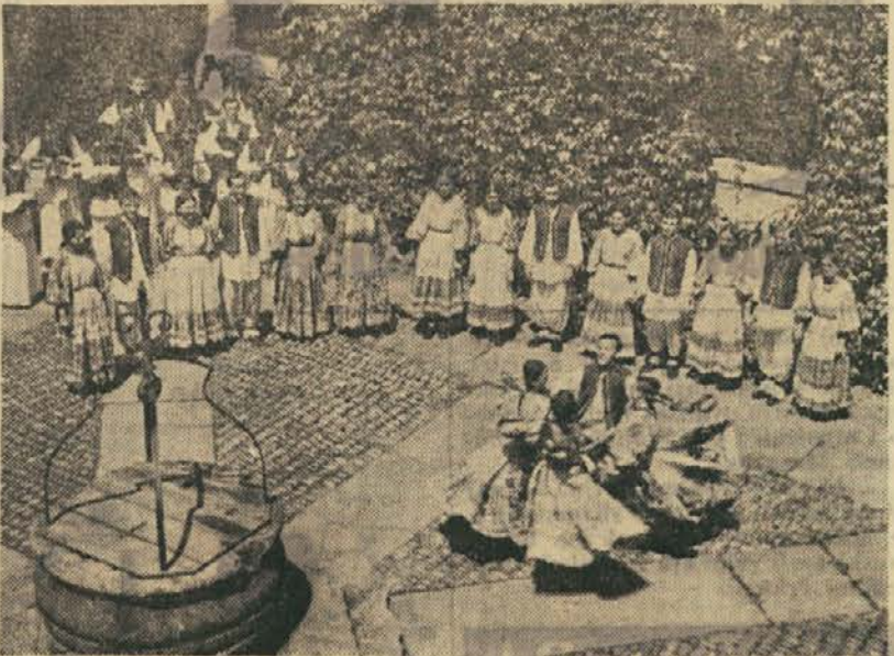
Folklorni nastop na Starem gradu v Varaždinu

Na višji tekstilni šoli je 50 študentov. Njihov študijski program je tesno povezan s prakso. Večina je bila že zaposlena v eni izmed tekstilnih tovarn, kamor se bodo po kon-