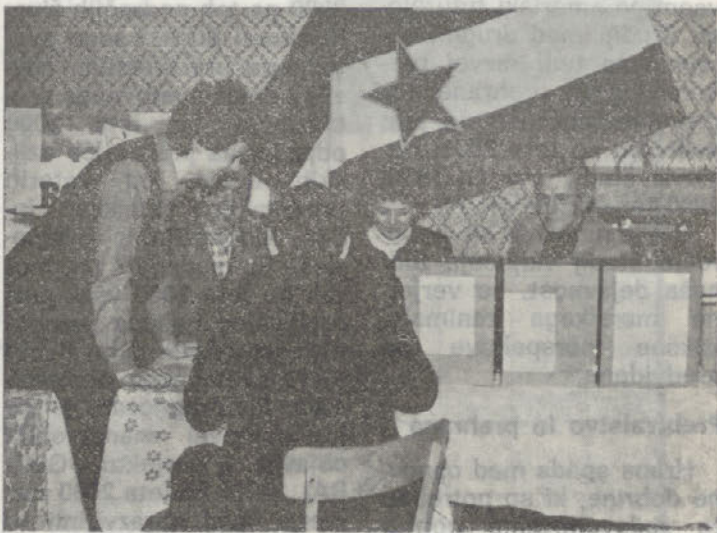
V TOK Hajdina so imeli ob volitvah precej dela, saj so kooperanti volili na sedmih področnih voliščih

še in lepše življenje. Prognoza, da bo leta 2000 na svetu živelo več kot 6 milijard ljudi, je pomembna tudi za nas, saj to pomeni, da bo potrebno za vse te ljudi v prvi vrsti proizvajati tudi hrano. Naša prizadevanja morajo iti v smeri, da bo naš delež pri tem čim