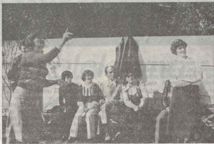
Tekmovalke pikada — Perutninskih farm — včasih nepremagljive, tokrat druge

do 3. aprila na telefon 772-511, — interno 210 — Krajnc. Posa. mezn. tekmovanje bo potekalo v dveh starostnih kategorijah — do 35 in nad 35 let. Ženske pa bodo igrale vse v eni kategoriji.