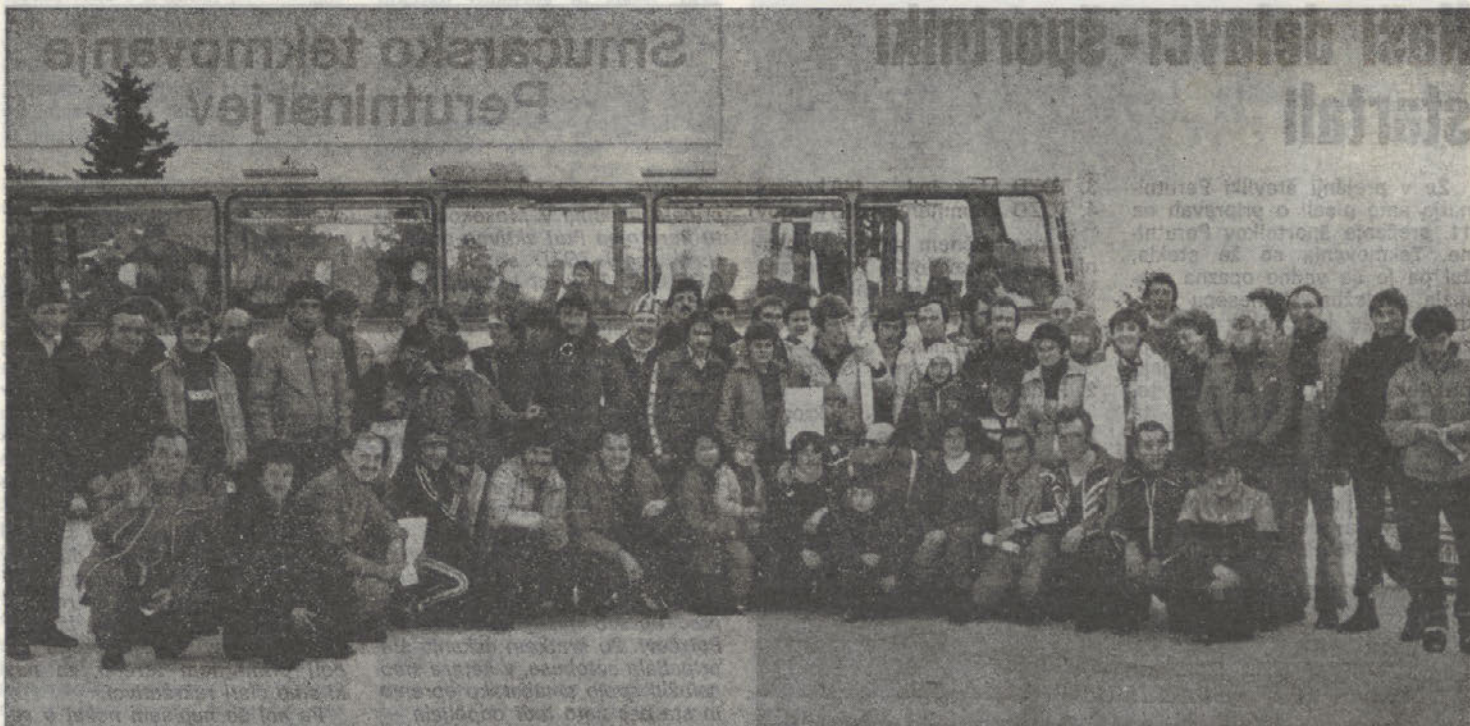
Del udeležencev smučarskega tekmovanja na Velikih Kopah