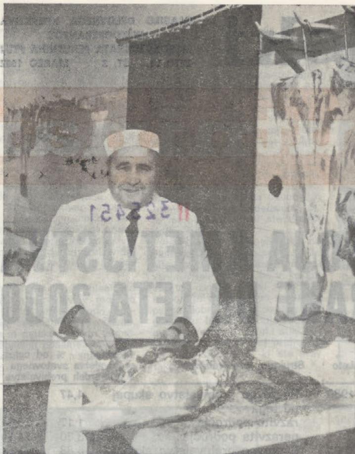
Tudi v bodočnosti bo (relativno) ceneno perutninsko meso nadomeščalo druge vrste mesa — nujnega prehranskega artikla

bruto proizvod na prebivalca v razvitih deželah gibal od 8.500 do 11.000 dolarjev, v nerazvitih, katerih delež bo leta 2000 skoraj 80 %, pa bi znašal okrog 600 dolarjev na prebivalca. Med najrevnejšimi na svetu bodo po sedanjih prognozah tudi leta 2000 ostajali Indija, Indonezija, Pakistan in Bangladeš, katerih družbeni produkt na prebivalca bo le okrog 500 dolarjev. Danes živi na teh področjih več kot 800 milijonov prebivalcev z manj kot 50 dolarji dohodka letno.