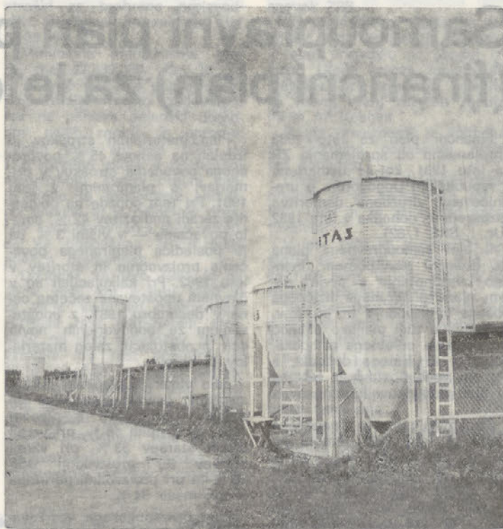
V silosih je krma bolj varna pred podganami kot v priročnih skladiščih v predprostorih vzrejnih objektov

ževanje (en par lahko da naše zatrlji, kjer se zatiranje ne leto osemsto potomcev), razšir-izvaja pa je rezultat ničen. enost po svetu, možnost prenašanja z enega področja na drugo, predstavljajo stalno nevarnost, da se pojavijo na še nezasedenih področjih in povzročijo ogromno materialno škodo ali prenesejo povzročitelje mnogih nalezljivih boleznii.