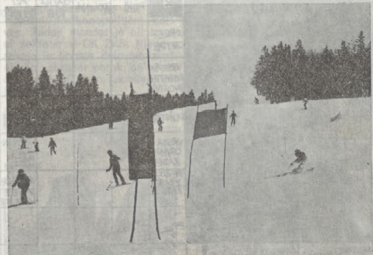
Na belih poljanah