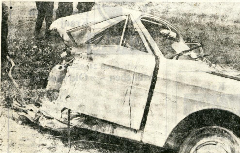
Ostanek taunusa ob nesreči pri Kovorju