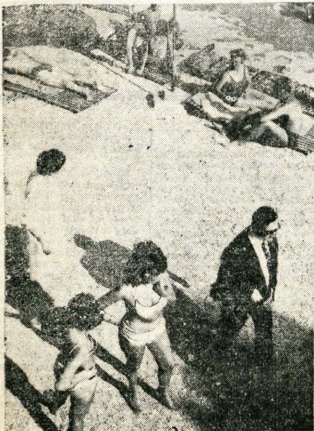
Izkoristimo še teh nekaj toplih dni

Popoldne so novoporočencema pripravili tudi pravo gorenjsko šrango. S. Z.