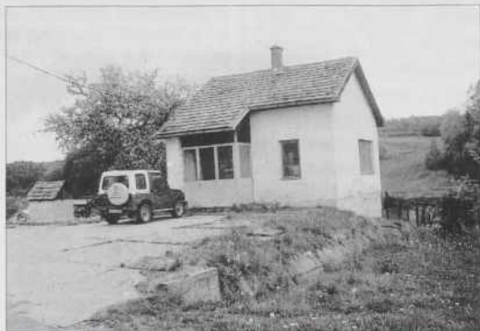
Es več nišče ne nosi mleško

gda so ga v bauti za staudvajsti odavali. Najprvin so v Števanovci pa v tisti krajini zaprli mlekarne. Letos od januara pa