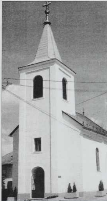
Kapejla v Slovenski vesi