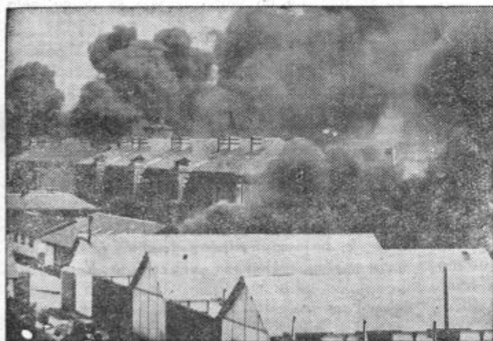
Levo: Prizor, ko gore ogromne zaloge olja v Brestu

V sedanjem ozračju ni mogoč noben napredek, dokler zavzemajo poedini člani gospodarskih zadrug na raznih sestankih stališče, da na vidno mesto v zadrugo mora priti le človek, ki