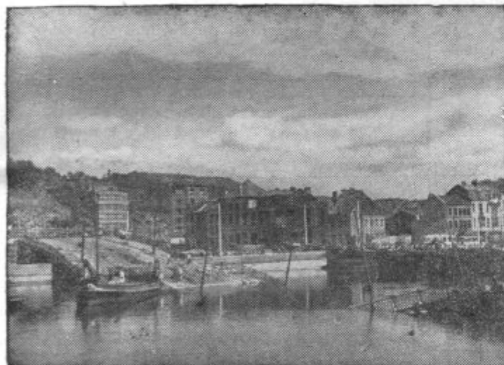
Levo: Porušen most čez reko Maas

*Na postajni blagajni kupite rumeno železniško izkaznico za din 2.—.