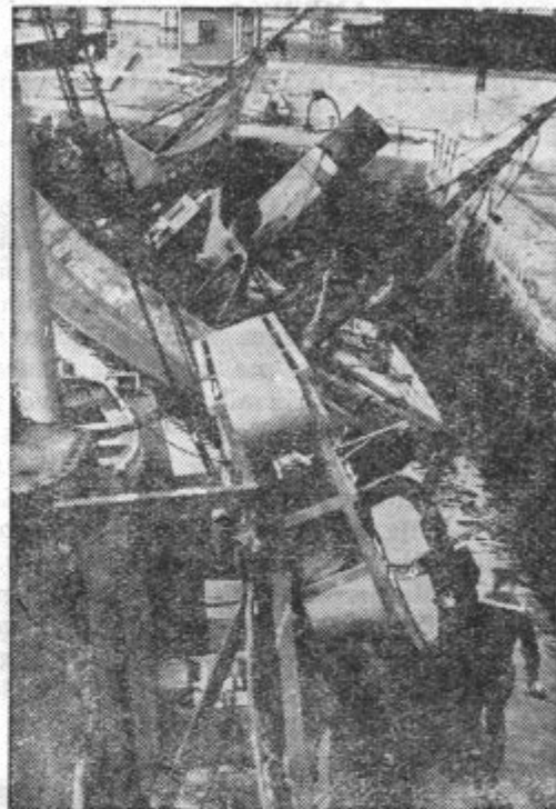
Strahotno razdejanje, ki ga je povzročila nemška bomba v Le Havreu

Angleška letala so vedno znova sejala bombe na postojanke nemškega daljnostrelnega topništva. Napadla so tudi veliko vojaško in letalsko oporišče Vila Coublée pri Parizu. Nekaj letal je prodrlo nad južno Bretagno ter