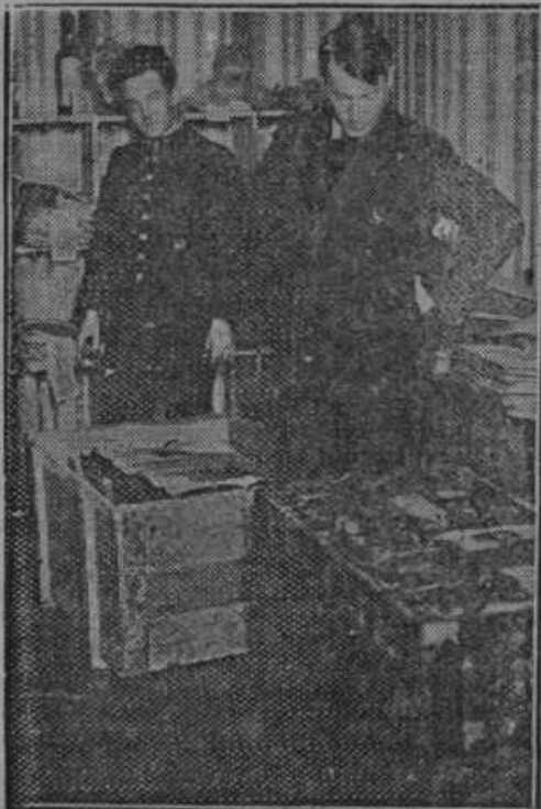
Prtljaga francoskega sleparja Staviskega.