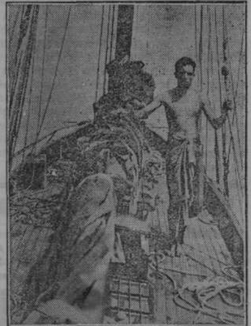
Z jadrnico hoče objadrati svet Francoz Alain Gerbault, ki se je podal na pot dne 27. septembra 1932 iz francoske luke v Marseille.