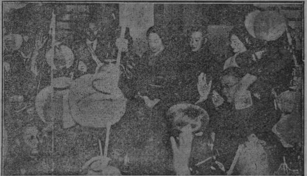
Na Japonskem so dobili prestolonaslednika in celo cesarstvo se je vzradostilo radi tega dogodka. Cesarski dvor se zahvaljuje ljudskemu navdušenju.

Mladostni vlomilci in tatevi na za- tožni klopi. Lansko poletje in jesen je vršila mladostna vlomilska družba pravo strahovlado nad mestom Kranj in nad okolico. Organizirana brezposelna družba se je klatila okrog pod svojim glavarjem in vlamljala, kjerkoli je čula, da je kaj denarja. Obtožnica pravi, da so nepridipravi lani dne 7. sept. pri belem dnevu udrli v trgovino Ahačič ter Šiferer v Kranju. Odnegli so gotovine 8900 Din. Glavar je razdelil plen med svoje tovariše tako, da je prejel eden 2200 Din, drugi 1200 Din. Po posrečenem vlamu se je odpeljala deteljica na Jesenice ter Bled ter zapravljala denar. Pri drugem večjem vlamu v Šavrovo krčmo v Kranju so računali na