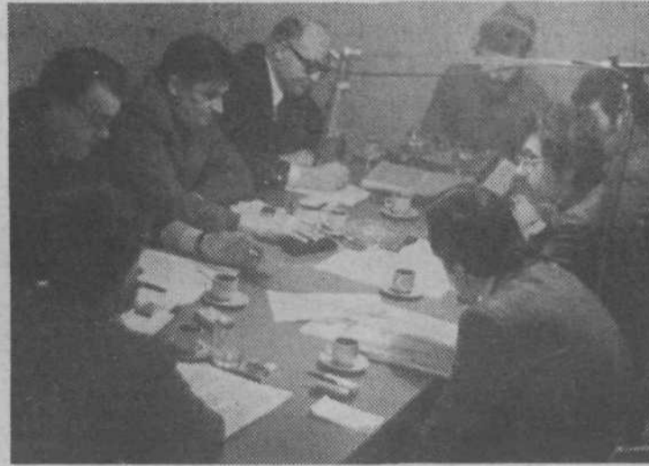
Pogovor „za okroglo mizo“ o uveljavljanju delegatskega sistema

čujejo v širši družbeni interes. Ugotavljamo tudi, da delegati v zboru združenega dela ne izkoristajo vseh možnosti. Zato bi v prvi vrsti morali priti do tega, da bi bile konference delegacij med sestavljenci dnevnih redov za skupščinske seje.