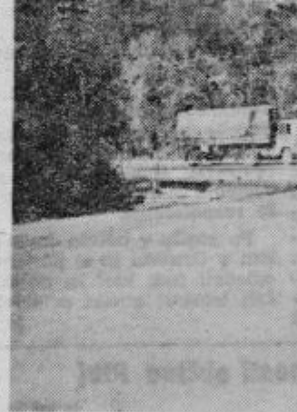
Cestišče je urejeno. Čakajo še železnico, kdaj bo postavila nove zapornice in razširila prehod

Da bo cesta Ormož — Čakovce v celoti »obdelana« se moramo dotakniti odseka Središče — Trnovci, ki bo, kot smo že pisali, ostala zaenkrat še makadamska. Po najnovejših vesteh pa se je tudi za to 2,5 km dolgo cestišče prižgala svetla luč. Na republiškem cestnem skladi zagotavljajo, da bodo sredstva za to že v programu za leto 1971. Ostane nam skupno upanje, da bo temu res tako in ta važna prometna žila, ki povezuje dve bratski republik drugi leto dokončno urejena.