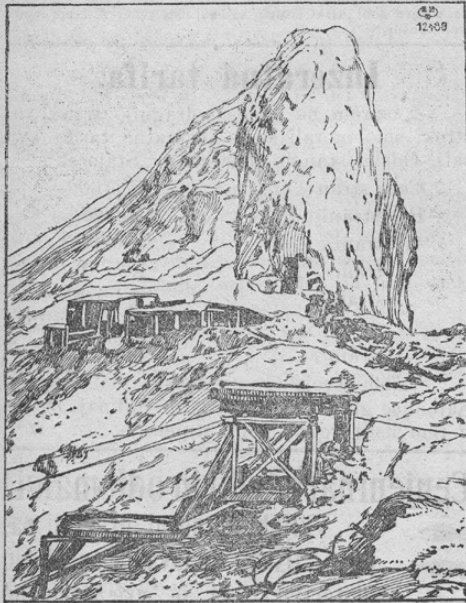
Desterr.-ung. Drahtseilbahnhafion und Unterkünfte. Hochgebirge.

fronti, obenem pa železnice na žico in bivališča čet, napravljena od naših vojakov.