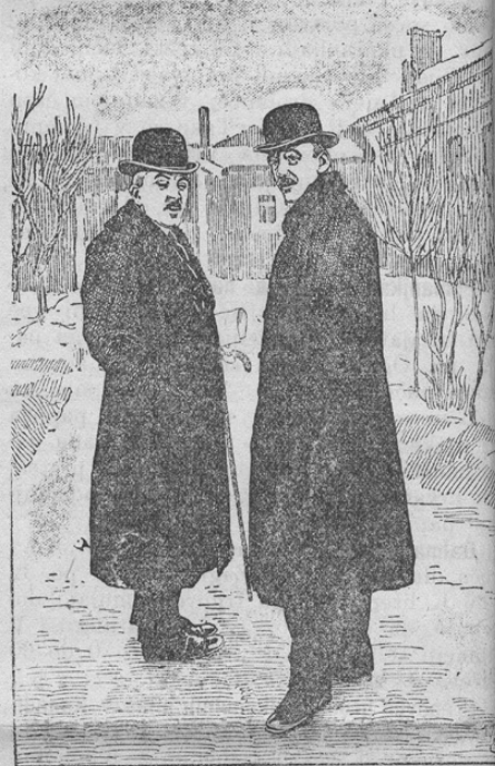
Von den Friedensverhandlungen in Brest-Litov. Exc. v. Kühlmann und Graf Czernin auf dem Wege zu den Verh.

Kakor poročano, vršijo se zdaj mirov pogajanja v Brest-Litovskem. Naša slika kaže prve zastopnika Avstro-Ogrske in Nemčije