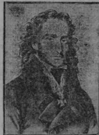
150letnica (27. oktobra 1732) rojstva enega največjih umetnikov na gosli Nikolaja Paganinija, ki je bil rodom iz Genove na Italijanskem.

Pol ure za tem je sporočil policijski komisar Teš ženi umorjenega vest, kje da so našli njenega moža. Gospa Glovan je seve izlila cele potoke solz ter glumila najgloblje žalost in potrlost. Teš pa ni bil vstopil v stanovanje umorjenega praznih rok, ampak z uradnim dovoljenjem, da sme napraviti hišno preiskavo. Hlačnike je našel že prav kmalu za stolom, na katerega je odlagal umorjeni pred počitkom slečeno obleko. Gospa Glovan je po kratkem tajanju priznala, da je spravila že postaranega moža radi tega s pota, da bi se lahko poročila z mlajšim.