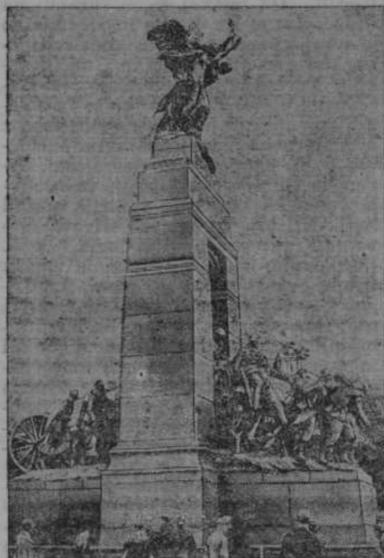
Kanada je postavila vojnim žrtvam spomenik.