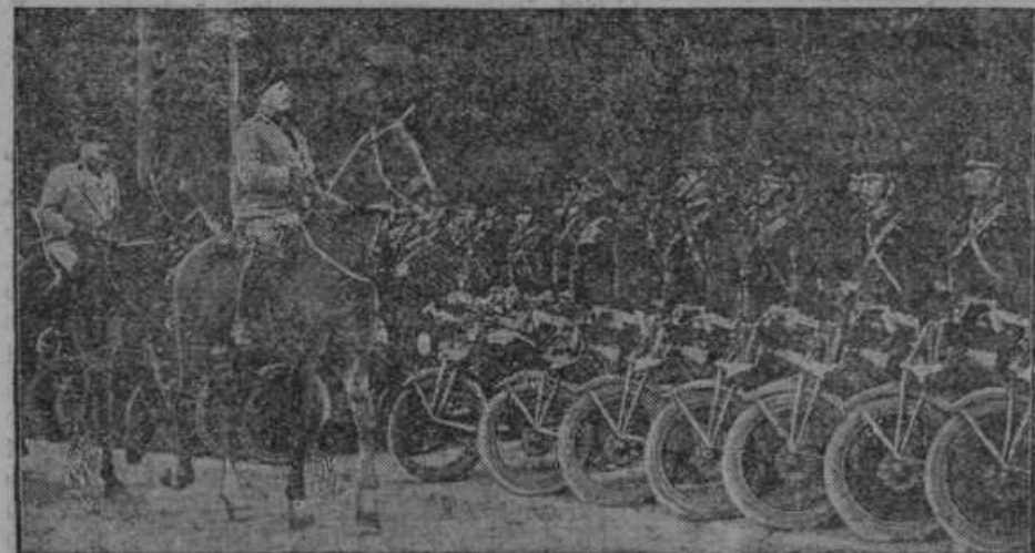
Mussolini pregleduje z motornimi kolesi opremljene policijske oddelke. — Desno: Nemški inženjer Tilling (levo poleg rakete) je dosegel z raketo višino 800 m. Raketa se je vrnila s te višine po razprostranju obeh peruti lepo na zemljo. Inženjer bo pognal te vrste rakete še v višino 7000 metrov.