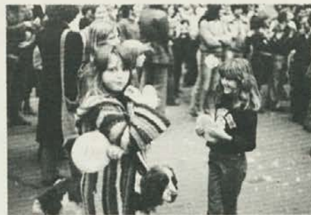
Sale za naše male ...