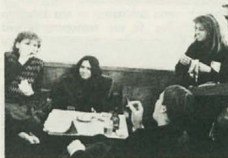
... drugi pa drugače!