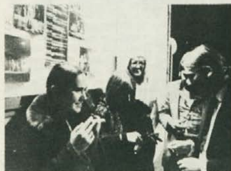
Konec jel Kam pa zdaj ...?