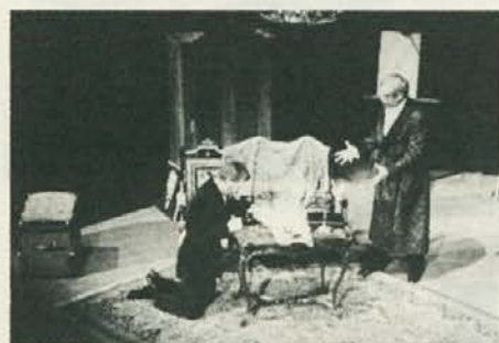
Oče: sin (SNG Ljubljana: Gospoda Glem-bajevi)