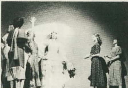
SLG Celje: Čarovnica iz Zgornje Davče