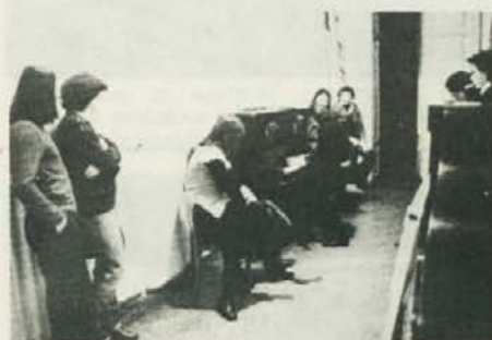
Med odmori se nekateri zabavajo po svoje