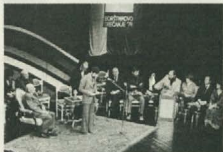
Letos, prvič, dosedaj je Katedra podelila nagrado za najvznemirljivejšo predstavo BS predstavi AGRFT: Tri medigre