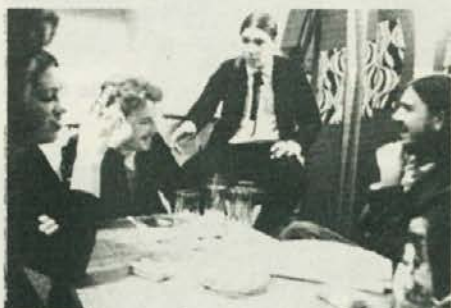
Debata po predstavi ...