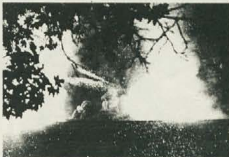
19. 10. 1978 ob 19. uri — otvoritev BS