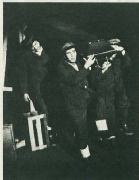
SSG Trst: Sedma zapoved — Kradi malo manj (nagrada občinstva)