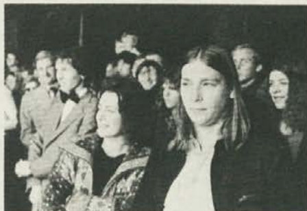
Nekateri so lahko prisostvovali samo ognjemetu ...

Nihče, ki ga njegovo delo ne zabava, ne more pričakovati, da bo s tem zabaval nekoga drugega.