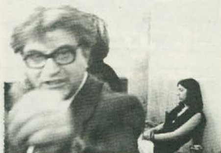
Razburjeno... in ... zamišljeno