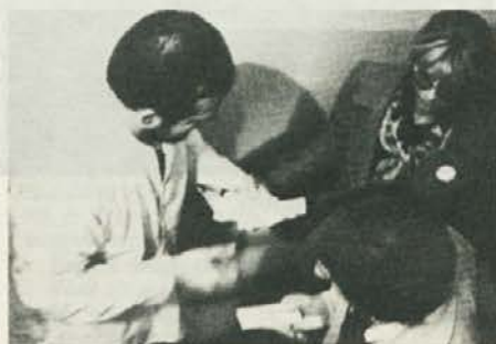
Da li ti fali koja daska...? Evo ti daskul