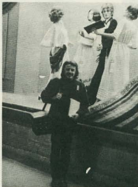
Borštnikovo srečanje za snobe in za našega akreditiranega novinarja