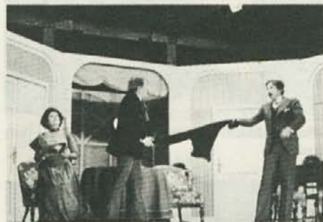
Teatar u gostima iz Zagreba je z lahkotno komedijo Gospod lovec navdušil kljub pozni uri in zakasnitvi