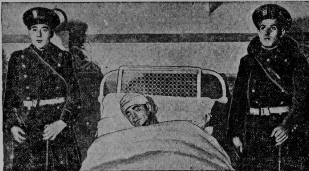
Spomin na španski puč... Eden od težko ranjenih komunistov v bolnici.