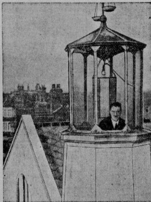
Svetilni stolp za avtomobilski promet, kakršni so postavljeni na avtomobilski cesti od Catorda proti Londonu. Imajo pa ta namen, da dajo avtomobilistom smerno orientacijo. Postavljeni so namreč tako, da so že od daleč vidni. Ponoči kažejo pot obračajoče se luči.

Pred dnevi je bilo objavljeno letno izvestje Controller-ja of the Curenacy, katerega ta navadno vsako leto predloži senatu; to izvestje ugotavlja, da je bilo v zadnjih 12 letih točno 10.000 bank, od teh jih je bilo v zadnjih štirih letih 6000 zaprtih. V letu 1932 je zaprlo nad 1100 bank svoje prostore. Največji delež tega poraznega števila pade seveda na podeželne banke, kjer se kriza radi padca agrarnih produktov najbolj pozna.