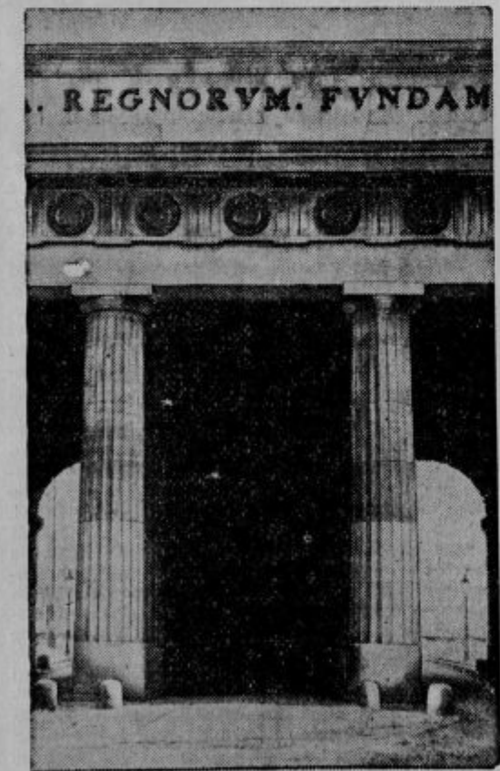
Spomenik Nezanega vojaka. Zvezno vojni ministrstvo na Dunaju je izkopalo na nekdanji italijanski fronti ostanke enega od avstrijskih padlih vojakov, pa te prenesla v novi grob, kjer naj večna luč sveti spominu padlih junakov.

Pariška občina je radi zmerom večjega prometa sklenila, da bo tekom petih let opustila ves tramvajski promet, na njegovo mesto pa bo stopil avtobus, s katerim se vrši promet laže in hitreje. V ta namen je že votirala občina 500 milijonov frankov in že v prvi polovici tega leta bo dala na ulice 300 avtobusov. London, še bolj prometno mesto, je to že pred leti storil.