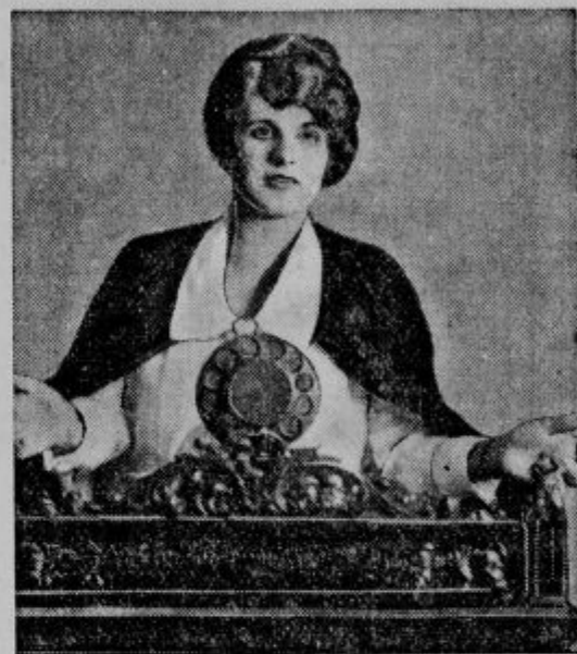
Aimee Pherson, ustanoviteljica in voditeljica ene od največjih ameriških verskih občin, ki je znana po svojih fantastičnih tempelskih zgradbah in glasnih reklamah, leži trenutno v Los Angelesu na smrt bolna. V njenem templu pa molijo »vesti verniki« dan in noč za zdravje svoje lepe pridigarce.