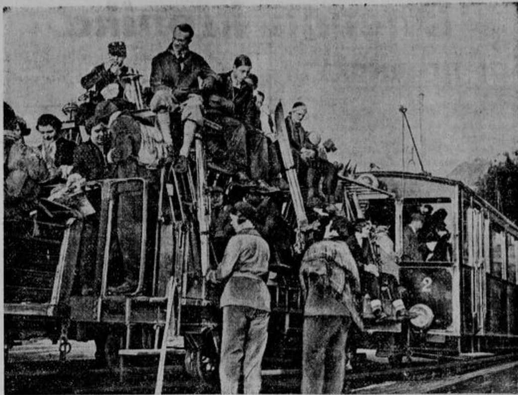
Zimski sportni vlak vozi sleherni dan nove smučarje na bele planine. Saj so komaj ućakali, da se je začela prava zima, ki jim bo nudila toliko prijetnih uric.