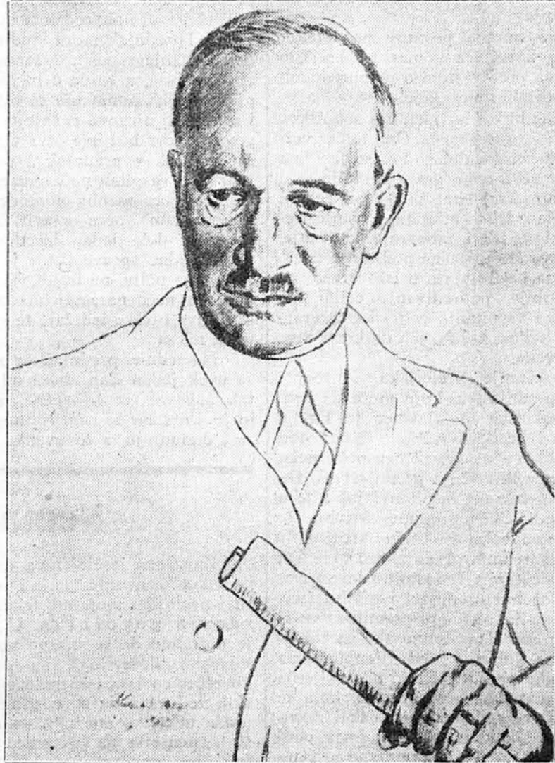
Dr. Eduard Beneš, pretsednik Češkoslovačke Republike

I naspoletku — kako nas uči šutljivi filozof — ako bi se mogli ljudi među sobom razumeti, u jedan mah imali bi demokraciju; bez međusobnog razumevanja, bez strpljivosti, nema nikakve slobode. Samo ako je čovek prema čoveku apsolutno istinit i iskren, samo tada se možemo uistinu spoznati. Bez ljubavi nema istine, bez istine i ljubavi ne može čovek spoznati čoveka.