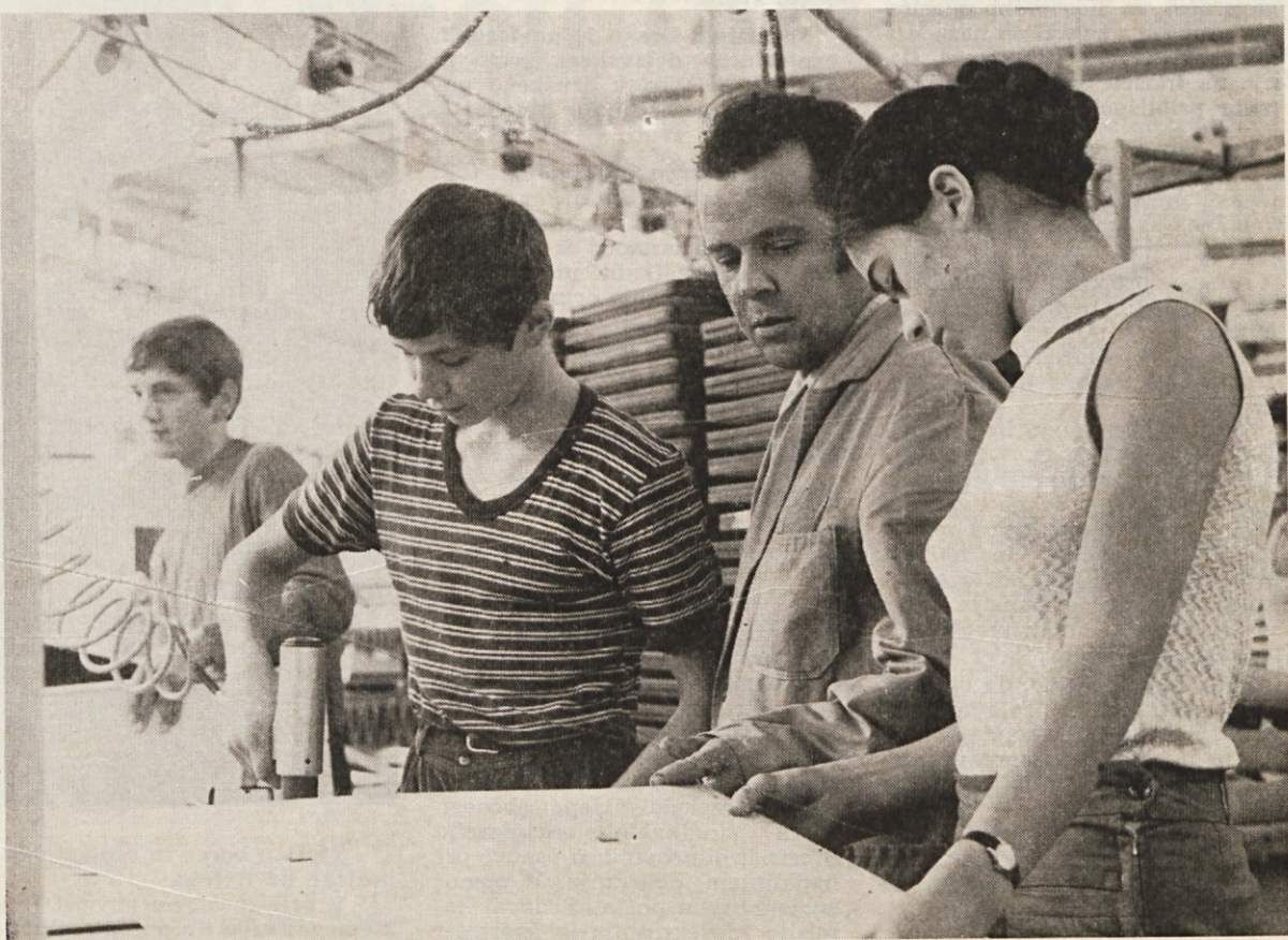
Mladi praktikanti pozorno sledijo navodilom svojega inštruktorja