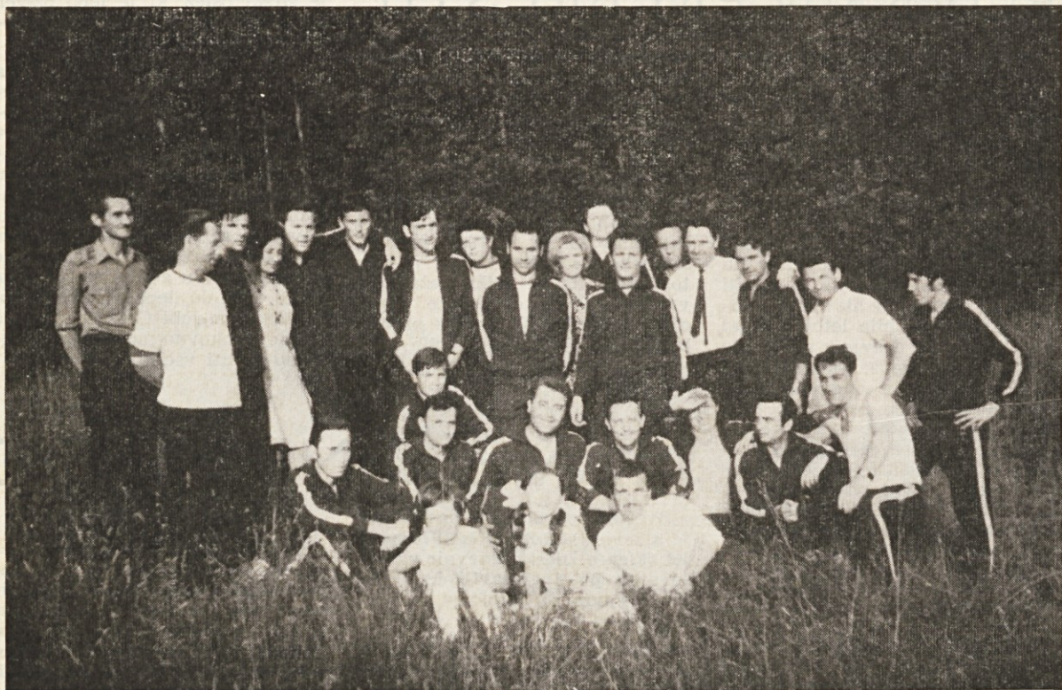
Skupina naših športnikov po uspešnem tekmovanju v Novem mestu

V organizaciji lesnega kombinata Novoles iz Novega mesta so bile 27. junija I. letne športne igre delavcev lesne industrije Slovenije. Na športnih igriščih v Novem mestu se je zbralo 400 tekmovalcev iz 18 delovnih kolektivov, ki so pomerili svoje moči v odbojki, streljanju, kegljanju in šahu.