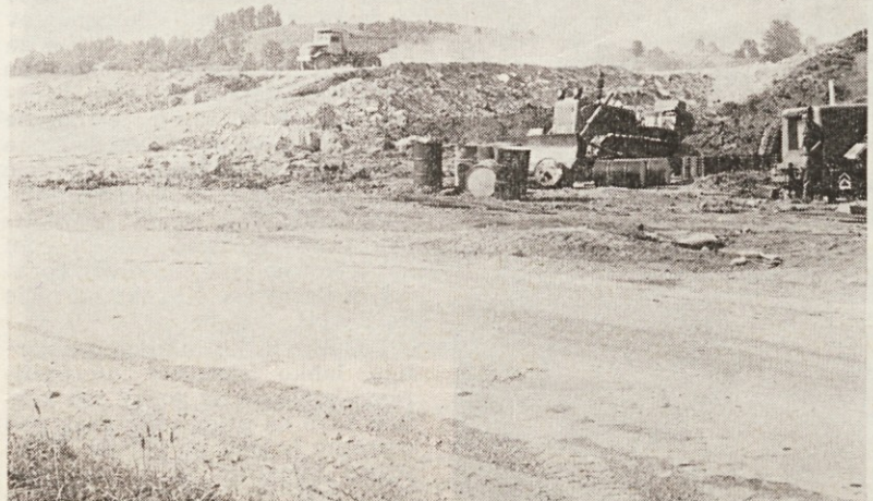
Delo na trasi nove avto ceste pri Uncu