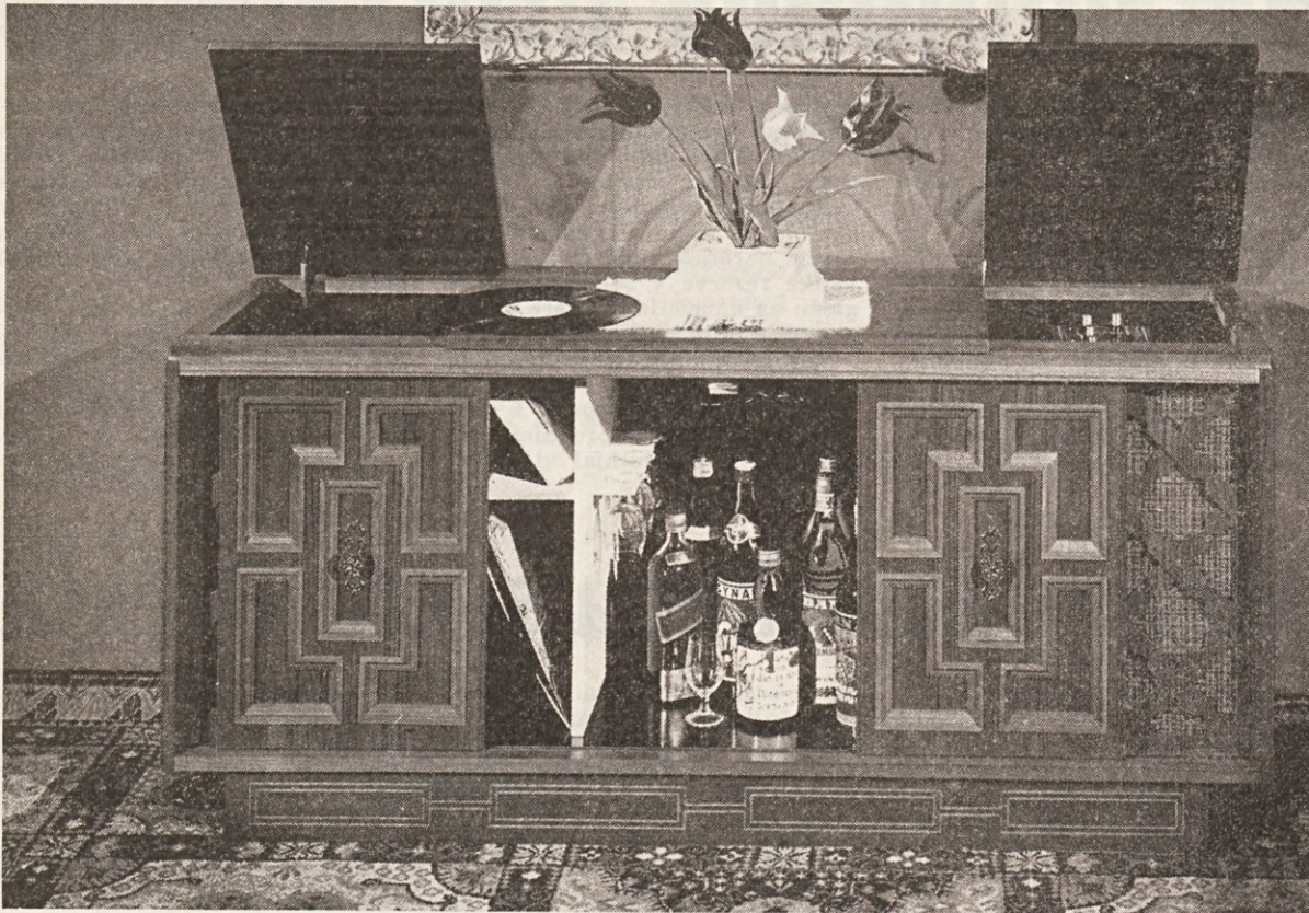
Naš novi izdelek — party bar Stereo

Skoraj vedno vsi soglašamo, da mora uvajanje novih izdelkov temeljiti na načelu: pravi izdelek ob pravem času.