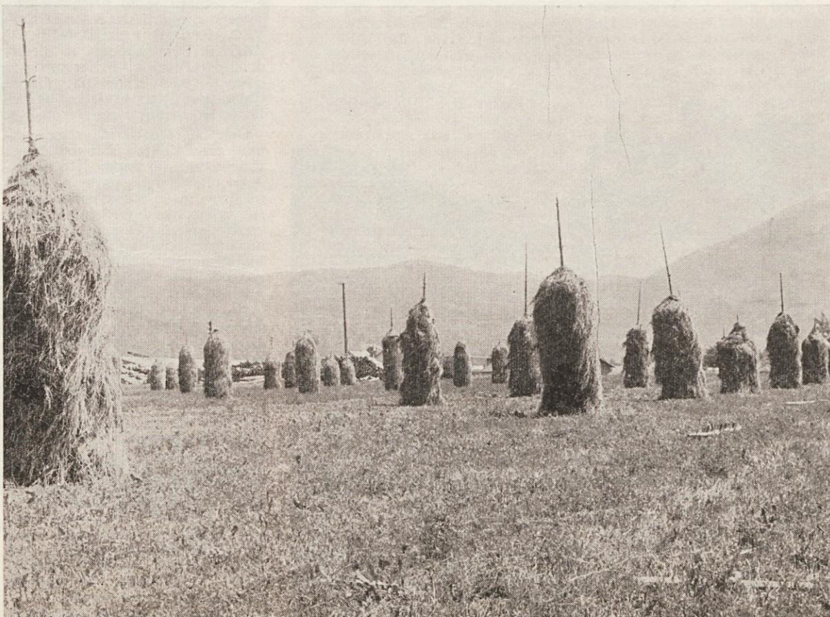
Idiličen podeželski motiv iz Loške doline

Ustanovili smo družbeno obrt, ki so ji preveč konkurirali šušmarji in privatniki, zato so ji klenila kolena že takrat, ko je bila še v povojih. Nerentabilne gostinske objekte smo dali v zakoncu na 6. strani