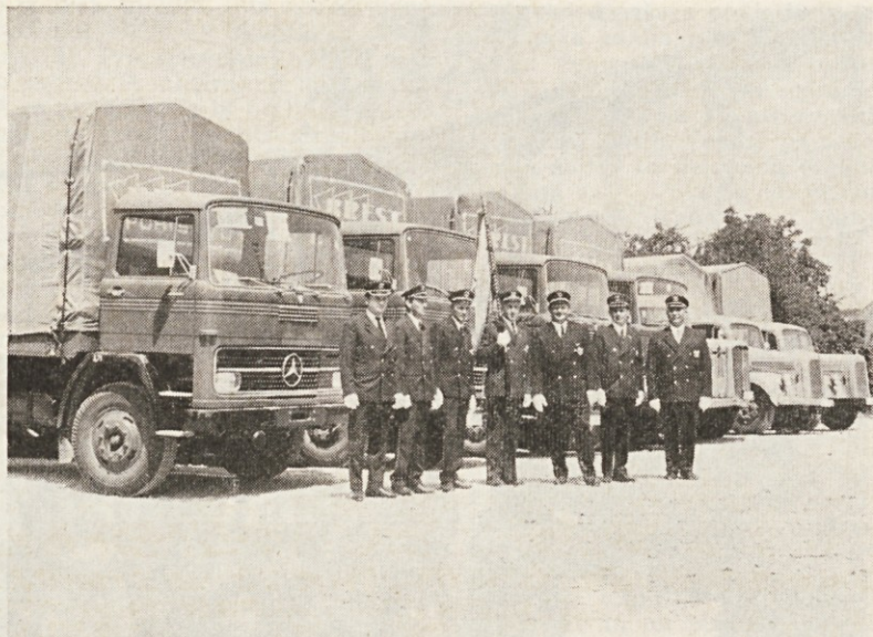
Za 13. julij, dan šoferjev, so se na cerkniški paradi predstavili tudi novi Brestovi kamioni