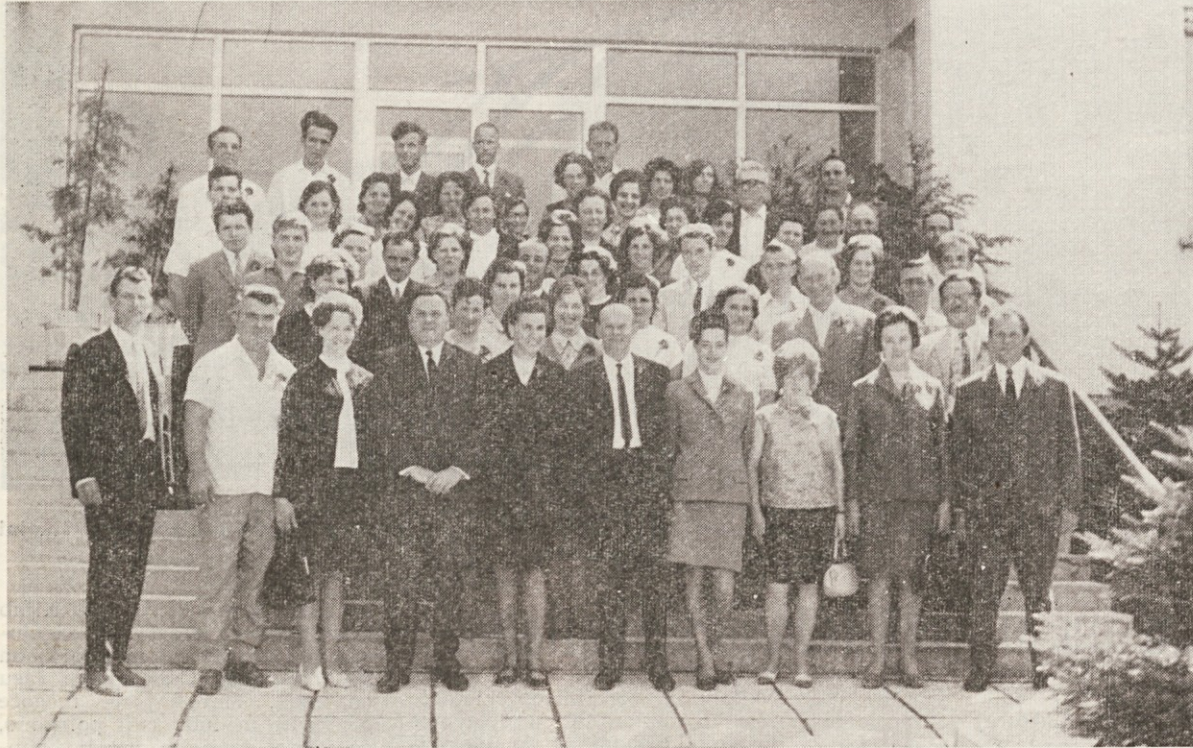
Jubilanti Tovarne pohišstva Cerknica

Uredniški odbor se pridružuje čestitkam kolektiva in želi jublantom nadaljnje uspehe v njihovem delu in življenju.