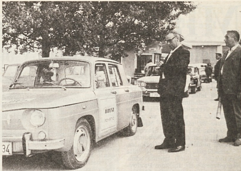
Start turistične karavane v Cerknici

Skupni ekipni zmagovalci je LIK Savinja iz Celja, Brest pa je pristal na 5. mestu. Če bi zanj nastopile še ženske ekipe, bi bila uvrstitev precej boljša, saj so v zbir točk šteli tudi rezultate ženskih ekip.