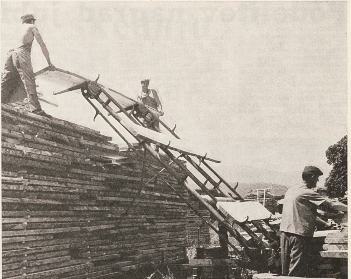
Naporno delo skladiščenja bukovega žaganega lesa v Tovarni lesnih izdelkov Stari trg olajšuje vertikalni transporter