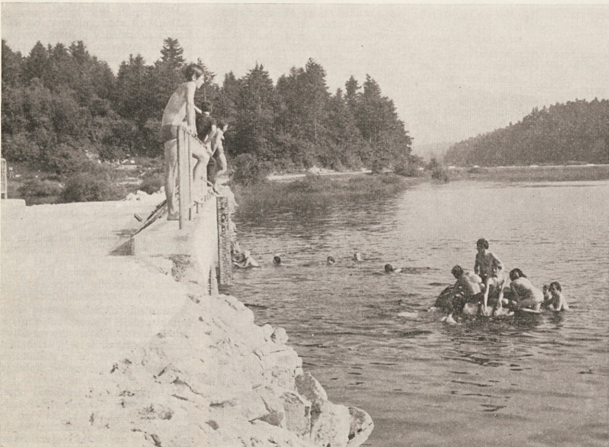
Voda v Cerkniškem jezeru je letos obstala — v veliko veselje kopalcev

Številne lovce so ob tej priložnosti odlikovali z lovskimi odlikovanji. Po svečanosti je bilo lovsko srečanje.