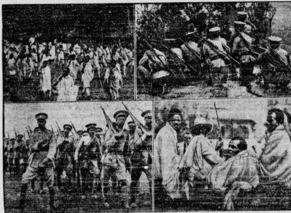
Neguševa armada. Prere: skozi abesinsko armado, v kateri je zastopano najstarejše orožje do najmodernejšega. Zgoraj na levi: Pred Addis Abebo se zbirajo vpoklicani vojaki. — Zgoraj na desni: Vojaki abesinskega topništva, ki ga pa ni veliko. Spodaj na levi: Neguševa garda, ki je moderno oborožena, a bosa. Spodaj na desni: Prostovoljci iz Harara gredo na fronto.