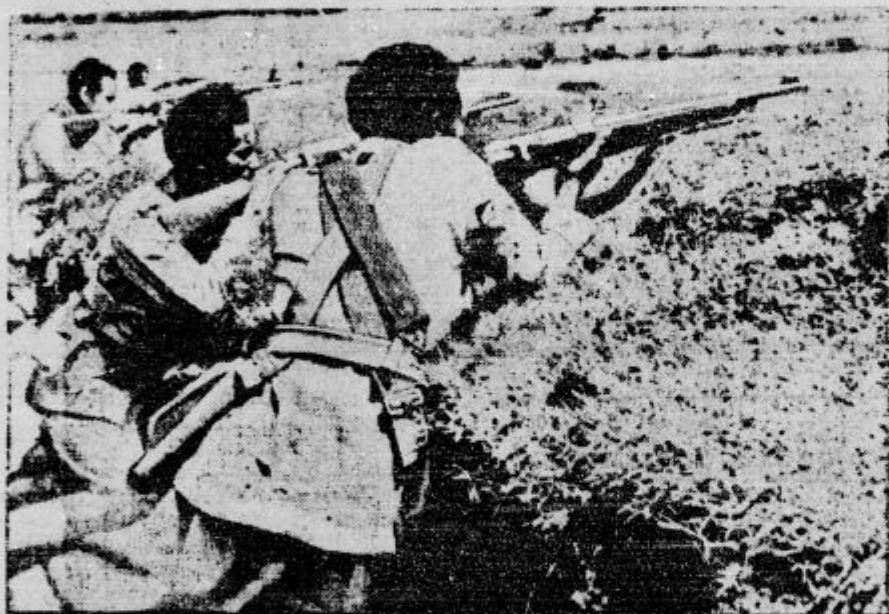
Strelnski jarki, izkopani po evropskem vzorcu, varujejo južno fronto Abesinije proti italijanskim četam.

joni, samo ne organizirani, saj je vsaka dobra gospodinja ali kdo drugi, ki se je zavzel za zapuščeno dekle, na tihem bila misijonarka. Ako smo ljudje in ako smo kristjani, moramo podpreti take misijone. Danes je beg z dežele v mesto. Umevno — na kmetih je revščina, v mestih pa navidezno ugodje in pa več svobode. Mi moramo to željo po svobodi uravnati, da ne bo povzročala kakor hudournik škode, ne družbi, ne narodu in dekletom samim, tako duhovne, kakor telesne. Delo Kolodvorskega misijona pa je ogromno. Dolžnost splošnosti, tudi tistih, ki vladajo, je, da to delo podpro, da se zidajo domovi za dekleta, ki jih je treba rešiti, in kjer bi se usposabljal za poštene poklice. Saj je to najbolj važno, da rešimo duševno in telesno zdravje naših deklet, ki so najlepše, najbolj važno, kar premore narod. Ako pa tega ne delamo, potem so vse besede o človečanstvu in kristjanstvu prazna pena.