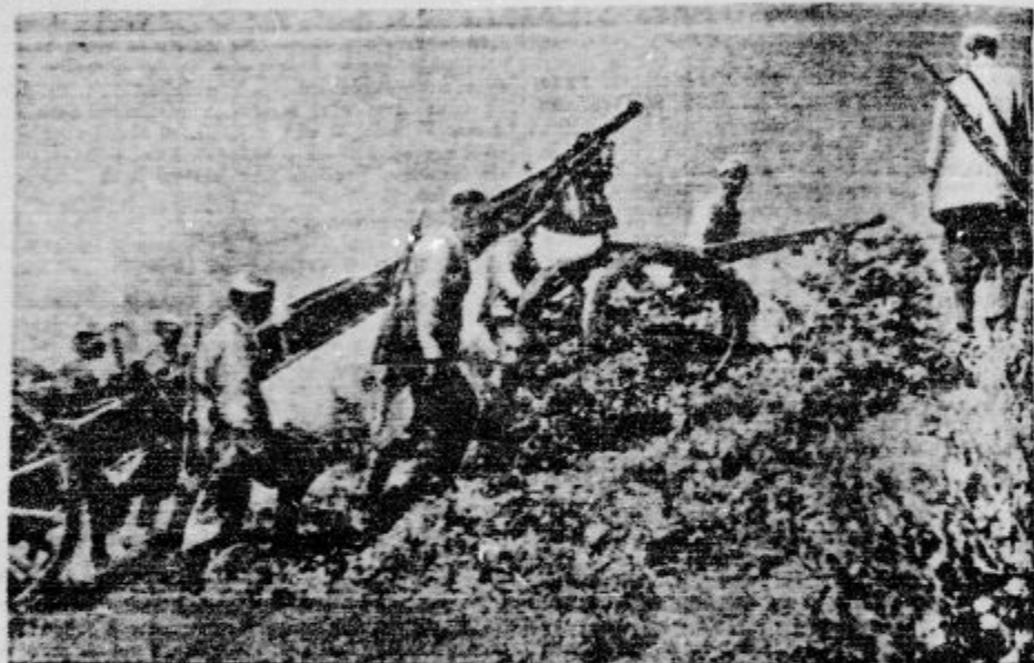
Italijani spravljajo topništvo po strmih pobočjih brez potov na postojanke v Abesiniji

»Pravda« poroča, da je v Harkovu vzel ob- last v svoje roke »Sovjet ukrajinskih soldatov«