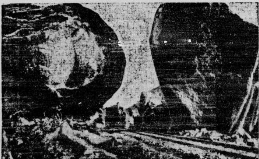
To je edina moderna prometna zveza Abesinije z morjem in s svetom. Razumljivo je, da bodo Italijani vse poskusili, da dobe to železnicno čimprej v svoje roke in da tako onemogočijo Abesincem dovoz orožja.