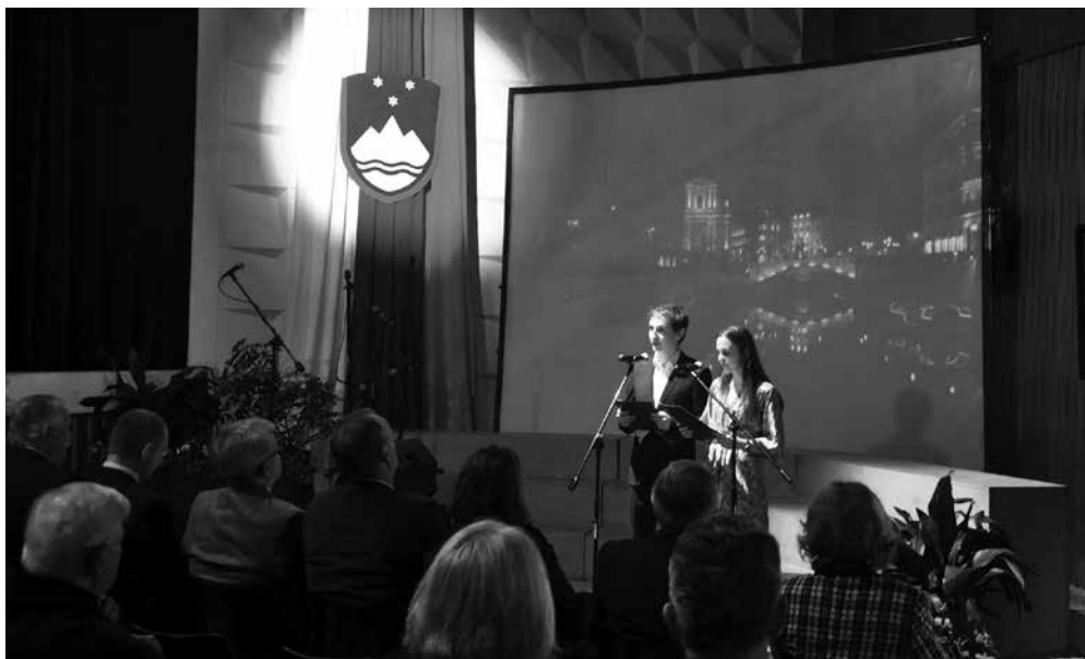
Slavje v dvorani škofa Rožmana