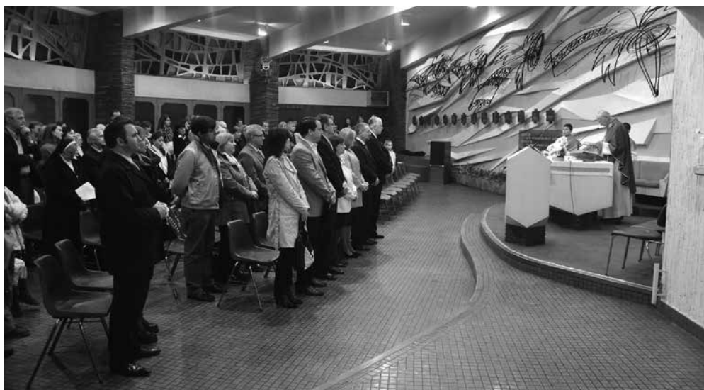
Zahvalna maša v slovenski cerkvi Marije Pomagaj