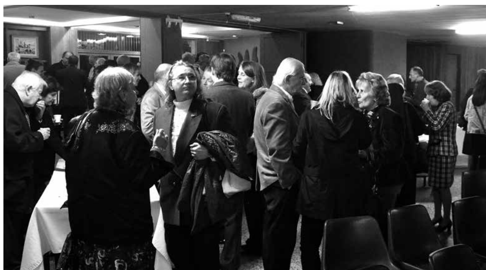
Rojaki po prireditvi v prijetnem pogovoru