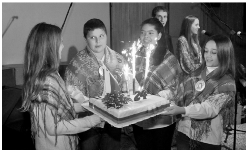
Svečke na torti: Vse najboljše, Slovenija!