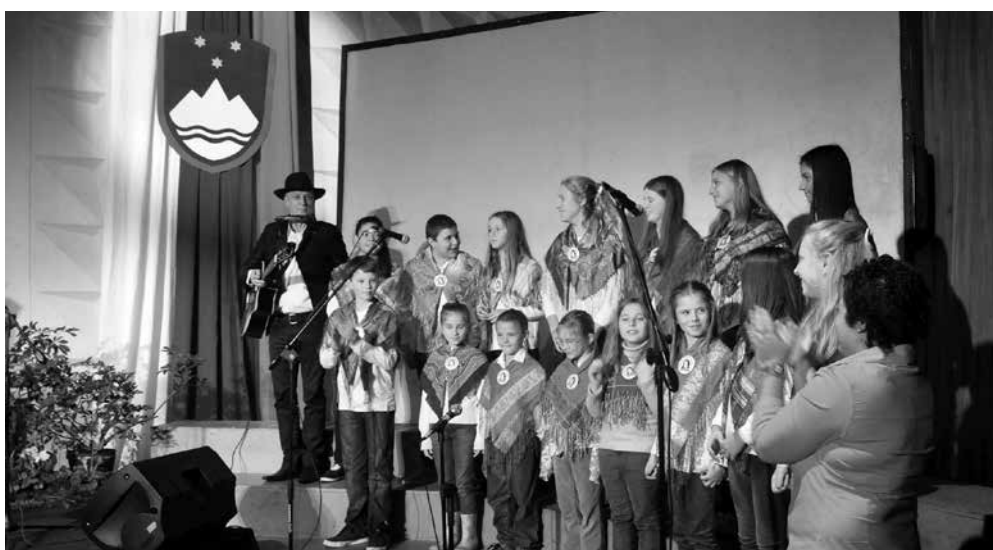
To pot skupaj s pristavskimi otroki