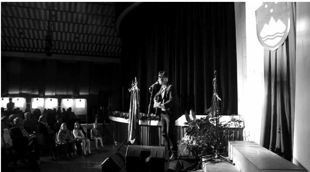
Poje Vlado Kreslin