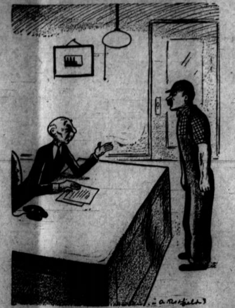
"Zal mi je, ker moram odsloviti starega delavca, toda kompanija potrebuje mlado kri."

njegov račun. Ritonja sam je z negotovo kretajo natakaj, z očmi pa požiral odvovelo krčmarico Maričko. Nekajkrat jo je tudi prijel okoli pasu in se potem izmivalno dvignil... V nasprotnem kotu je v gostem dimu kvartalo nekaj grančarjev, med njimi tudi zagoreli Sima, ki ga je imel Ritonja v želodcu. Sima je bil hudč, povrh pa se je še kaj rad klatil okoli Maričke. To je Ritonjo najbolj pekilo; zato je dajal za pijačo, zato iskral prepira s Simo. Vedel je, da bo večina zanj. Tudi Stevek se je kar naenkrat znašel pri Ritonjevi mizi. Silili so ga z vinom. Zapovrstjo je potem moral eksati. Glava mu je postajala težka, vino mu je lezlo v ude. Ob petih je bil z ostalimi vred že tako pijan, da se niti malo ni zavedal, kaj počne in kaj govoriči. Ko se je od nekod vzel še Horvatov Janč in raztegnil harmoniko, je hotel celo zaplesati. Od tega pa ga je odvrnil prepir.