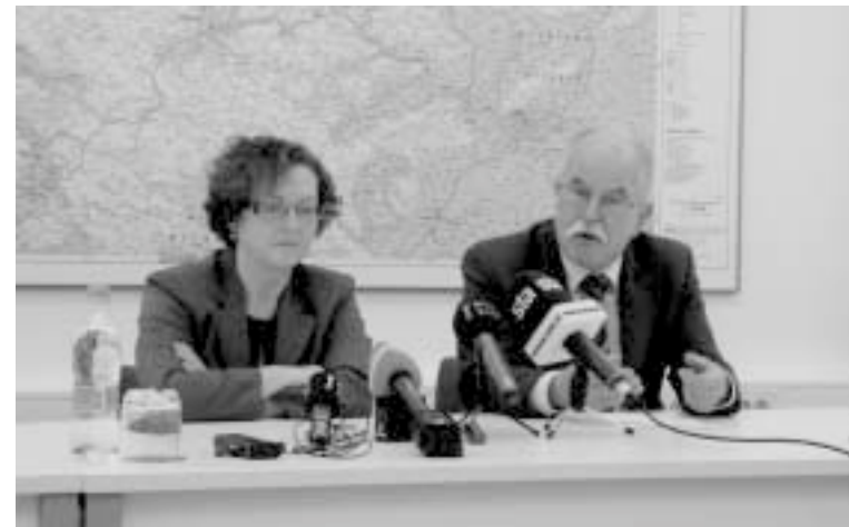
Minister in senatorka na tiskovni konferenci

Pričakuje, da bo manjšina bolj dejavna in aktivna ter bo skušala gledati bolj naprej. „To se v zadnjem