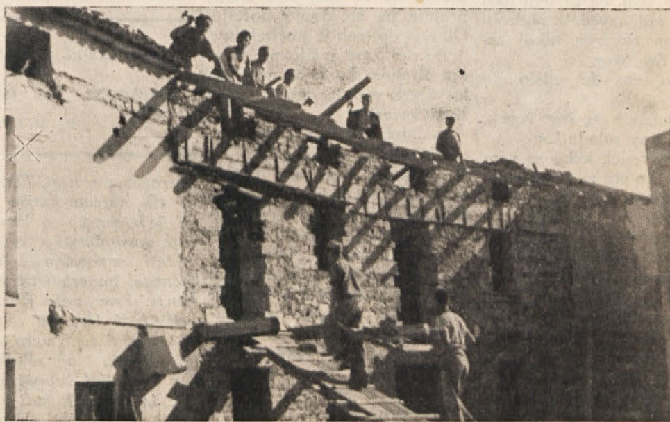
Na Krasu obnavljajo

Ta prelepa dežela ob Soči si je zapisala v zgodovini vseh svobodoljubnih narodov nevenljiv spomin na težke boje, ki jih je goriško ljudstvo bojevalo z okupatorjem. V svojem besu in sovraštvu do Slovanstva je nacifašizem hotel iztrebiti tudi slovenski rod. Moril in mučil je to ljudstvo, ga gnal v taborišča smrti ter mu požigal domove. Toda vse je bilo zastoj. Goriško ljudstvo je ostalo in bo kljubovalo še nadalje vsem krivičnim mogočnikom, pa naj pridejo od katerekoli strani. Težke preizkušnje so šle mimo goriškega ljudstva. Velika večina bo ustvarila dobrine in si ohranila svoj mir in blagostanje v mladi republici Jugoslaviji. Ostali, ki bodo priključeni Italiji, bodo deležni vseh pravic manjšin, ki jim jih je dolžna dati mlada demokratska republika Italija.