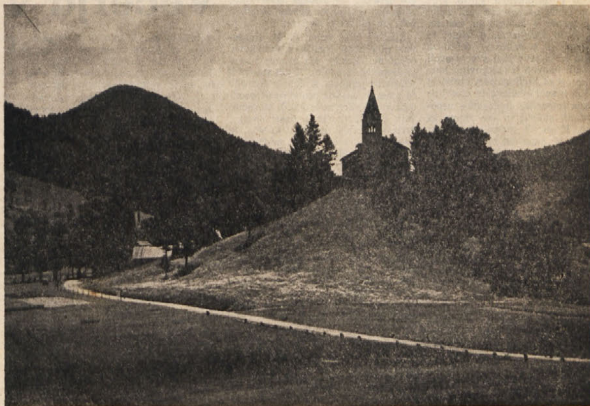
Lokve pred vojno