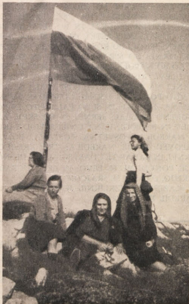
Nanos — lepa naša domovina

Lepa je naša goriška dežela. Ljudstvo, ki prebiva na tem najzahodnejšem delu slovenskega debla, je dobro in miroljubno. To svojstvenost našega goriškega človeka je moral — hočeš, nočeš — priznati tudi sovražnik.