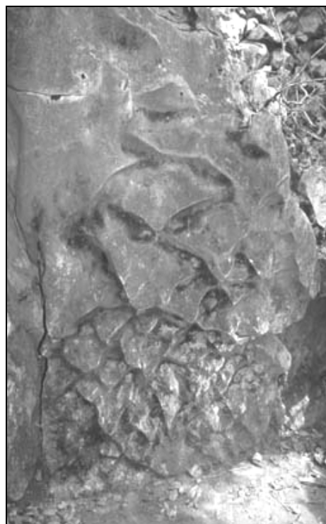
Sl. 5: Podtalne fasete. Lunanski kamniti gozdovi, Yunnan, Kitajska. Fig. 5: Subsoil scallops. Lunan stone forest, Yunnan, China.

talna voda in se v celoti oblikujejo pod tlemi, so priostreni. V zgornjem delu prevladuje razmeroma gladka, za oblikovanje pod prstjo in drobnozrnatimi naplavinami značilna skala. V spodnjem delu škrapelj so najbolj izrazite podtalne zajede. Večje in vodoravne dosežejo meter premera, manjše so ena nad drugo. Polkotličaste zajede so zaključki navpičnih podtalnih žle-