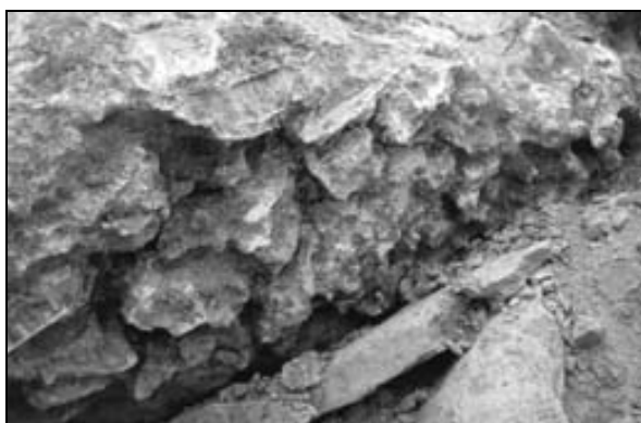
Sl. 4: Podtalne anastomoze na bazalnem konglomeratu v flišu nad Kastelcem, odkrite med graditvijo avtoceste. Fig. 4: Subsoil anastomoses on basal conglomerate in flysch near Kastelec, discovered during motorway construction.

ževnica. Podtalni žlebovi začnejo preoblikovati skalo, tudi dežne skalne oblike, ob ponovnem zaraščanju nekoč razkritega krasa (Jennings, 1973). To je značilno tudi za klasični Kras, kjer skalo vse bolj izrazito prekriva preperelina ali debela plast mahu.