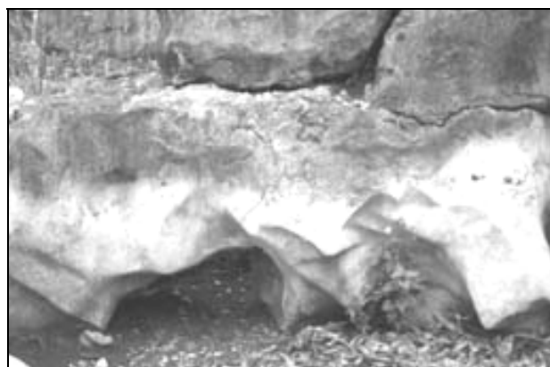
Sl. 8: Podtalna zajeda z votlino. Pu Chao Chun kamniti gozd, Yunnan, Kitajska.

Manjše votline (Gams, 1971), katerih premer meri od cm do dm, votlijo skalo v različnih smereh in so pogosto povezane v splet. Večinoma so nastale na izrazito razpokani ali porozni kamnini. Pri njihovem oblikovanju pogosto pomembno sodeluje tudi rastje.