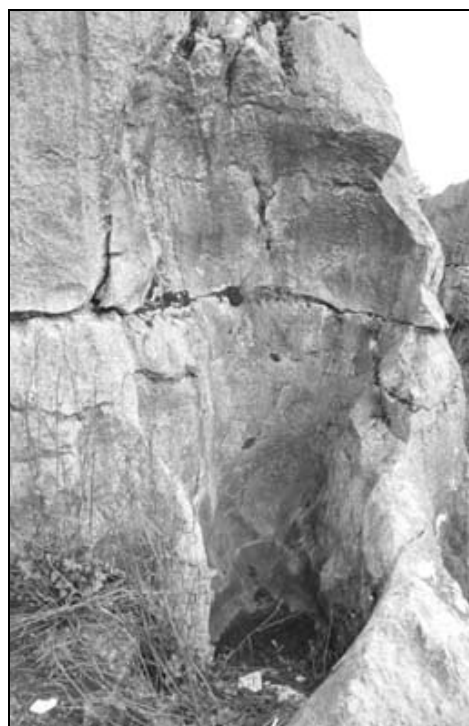
Sl. 1: Razgaljeni podtalni žleb. Lunanski kamniti gozdovi, Yunnan, Kitajska.

Podtalni žlebovi nastanejo zaradi strnjene pretakanja vode ob stiku s prstjo. Največji (Sl. 1) praviloma nastanejo, ko voda zateka za navpični ali strmi stik. Premer velikih, praviloma navpičnih in posameznih žlebov meri od 20 cm do meter in več. Ob razpokah, kjer so žlebovi najbolj pogosti, so globlji, ob najbolj izrazitih lahko nastane podtalno brezno. Velikost premera je lahko v istem žlebu različna. Globlje pod prstjo in naplavino so veliki žlebovi pogosto ožji. Kamnina se torej najhitreje raztaplja ob zgornjem delu prsti in naplavine. Izraziti in raznovrstni žlebovi so v lunanskem kamnitem gozdu. Razširitve v podtalnih žlebovih Song Linhua