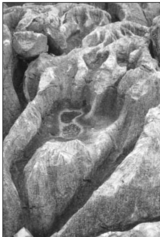
Sl. 3: Mreža podtalnih žlebov. Lunanski kamniti gozdovi, Yunnan, Kitajska. Fig. 3: Network of subsoil channels. Lunan stone forest, Yunnan, China.

Posebni žlebovi (Sweeting, 1972) se oblikujejo, ko so le ti zapolnjeni s prstjo ali pa je prekrito njihovo dno, okoli pa je skala razgaljena. Največkrat imajo značilno obliko na glavo obrnjene grške črke omega. Lahko so nadstropni. Zaradi nižanja nivoja prsti se je ta zadržala le na dnu žlebov in jih zato poglobila in razširila. Žlebovi vodijo tudi iz podtalnih vdolbin, torej na mestih stekanja vode. Pogosto so se razvili iz podtalnih cevi, ki so se razkrile, ko so razpadli zgornji skladi kamnine. Slednji se kot podtalni žlebovi oblikujejo od trenutka, ko je nivo prsti, ki obdaja stebre, nižje od žlebov. Pogosto je moč slediti prehodom iz žlebov, ki so nastali na skali, povsem prekrite s prstjo v tiste, ko so prekrite le žlebovi. Po razgaljenju, ko v njih ni več prsti, jih preoblikuje de-