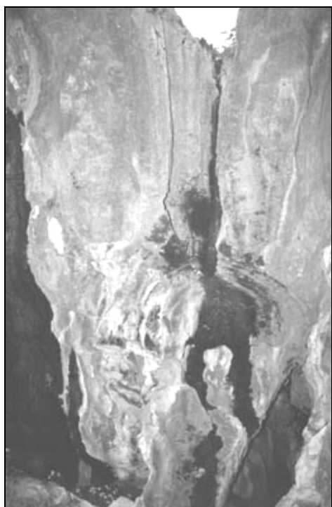
Sl. 9: Razgaljeni podtalni polzvon. Shilin kamniti gozd, Yunnan, Kitajska.

Nastanejo zaradi razjedanja skale ob dolgotrajnem nivoju naplavine ali prsti, ki jo obdaja (Sl. 8). Do stika priteka voda po večji površini, ga bolj ali manj izrazito razjeda, nato pa zateka med kamnino in prst. Manjše podtalne zajede s premerom od 10 do 20 cm imajo obliko polkrožnih vodoravnih žlebov, le njihovi zgornji robovi so največkrat bolj ostri, spodnji pa zaobljeni. Večje podtalne zajede (Jennings, 1973; Ollier, 1984; Waltham, 1984; Ford et al. , 1997) so meter in več globoko zajedene v skalo, pogoste so tudi v lunanskem kamnitem gozdu, kjer so do meter visoke. Spodnji del zajed je spodjeden. Skala je bila namreč podvržena hitrejšemu, dolgotrajnemu raztapljanju pod vlažnimi tlemi in je zato tudi zaobljena in gladka. Spodnja ploskev zajede je vodoravna, zgornja pa polkrožno povija proti spodnji. Zgornji del zajed je preoblikovan zaradi polzenja vode po skali navzdol. Sprva nastanejo torej manjše polkrožne zajede, nato pa ob počasnem nižanju nivoja naplavine lahko rastejo v vse večje. Zajede je moč opaziti na različnih višinah hitro in skokovito razgaljenih skal. Manjše in izpostavljene zajede so bolj, velike