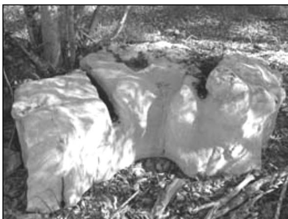
Sl. 2: Podtalni žlebovi. Matarsko podolje. Fig. 2: Subsoil channels. Materija lowland.

Tudi na manj ali bolj položni skali, ki jo prekriva prst,