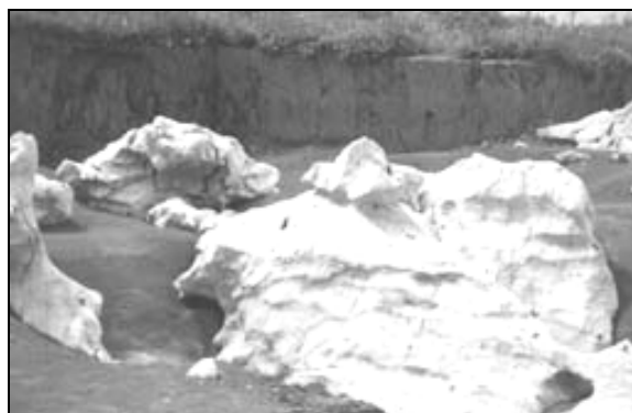
Sl. 6: Občasno poplavljeni podtalni škraplje. Uvala pri Biču na Dolenjskem. Fig. 6: Periodically flooded subsoil karren. Uvala at Bič, Dolenjska region.