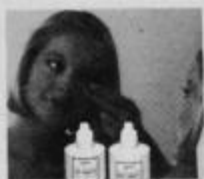
kontaktne leče in tekočine