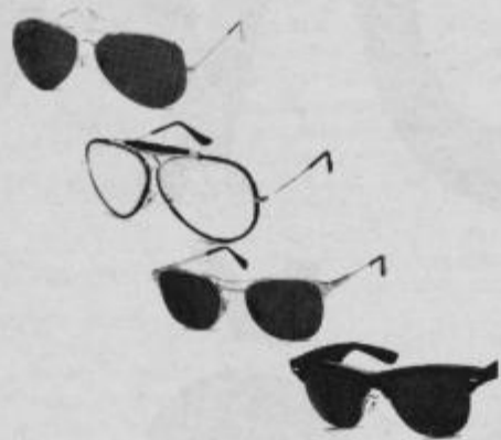
bogata izbira sončnih očal

M mladinska knjiga trgovina d.d. ptuj, tltov trg 3