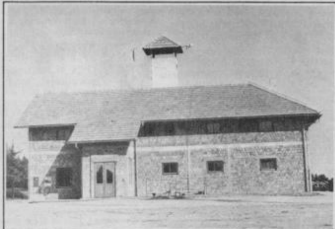
Upajmo, da bo dom dobil dokončno podobo

V njem je pet sodobnih garaž in prostorov, ki so namenjeni za gasilsko opremo, dve pisarni, garderobni prostor ter sanitarije. Zgornja etaža, ki še ni dokončana meri 300 kvadratnih metrov. Objekt, ki je namenjen za širše območje občine Lenart so predali svojemu namenu. Gasilci iz Lenarta upajo, da se bo našel denar za njegovo dokončanje.