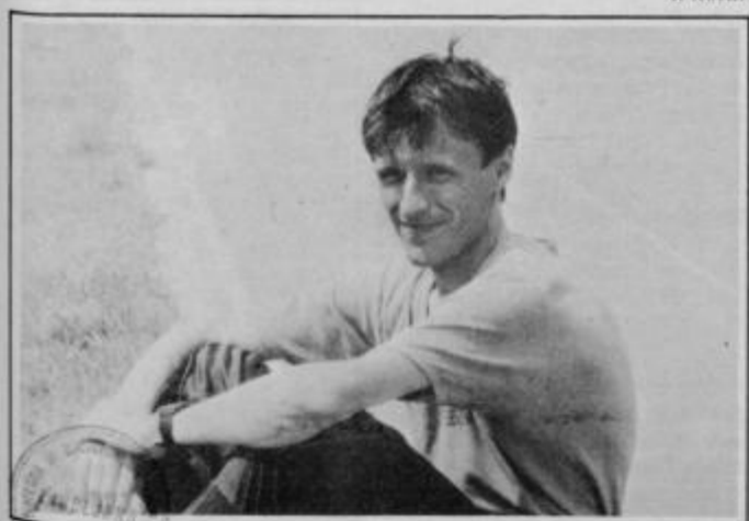
Dve olimpiadi sta za njim, pred njim je tretja!