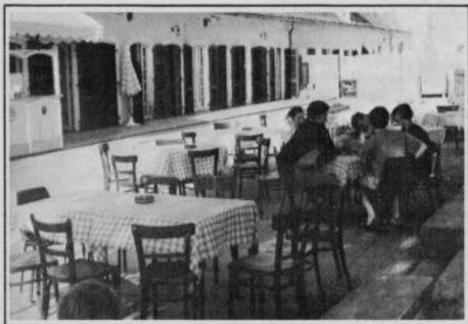
Podoba restavracije na gradu