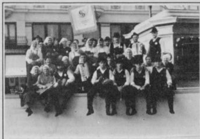
Člani FD Lancova vas v Zagrebu

S svojim programom pe-smi, plesov in običajev so lancovski folkloristi dostoj-no predstavili svojo vas, ptujsko občino in kot edina skupina tudi mlado državo Slovenijo na tej mednarodni folklorni prireditvi. JB