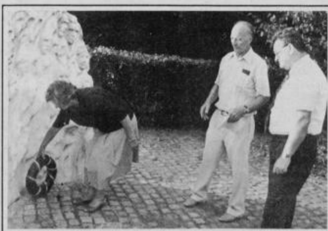
K spomeniku poslednjega boja Slovenjgoriške čete so položili spominski venec.