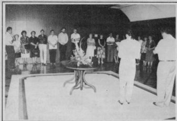
Aktivisti ptujske Karitas so bili sprejema pri županu iskreno veselji.