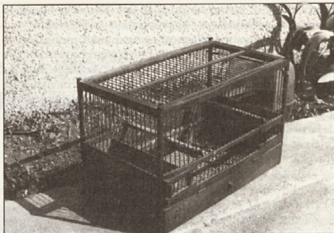
"Ajncl" številka 11.

Ljudje, ki so živeli v mestu, odrezani od narave, so imeli v stanovanju radi pernatega prijatelja. Tudi nekateri Trnovčani pri tem niso bili izjema. Moj sogovornik se spominja, da