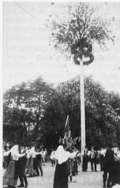
Majenca '93 v Dolini

Do pred kratkim je bila ta slovenska knjigarna last Založništva tržaškega tiska. Bivši uslužbenki sta jo pred nedavnim prevzeli in jo bosta odslej vodili kot lastnici. Obljubljata, da bo ponudba slovenskih knjig in časopisov ostala enaka kot prej. Razširiti pa nameravata ponudbo papirnice.