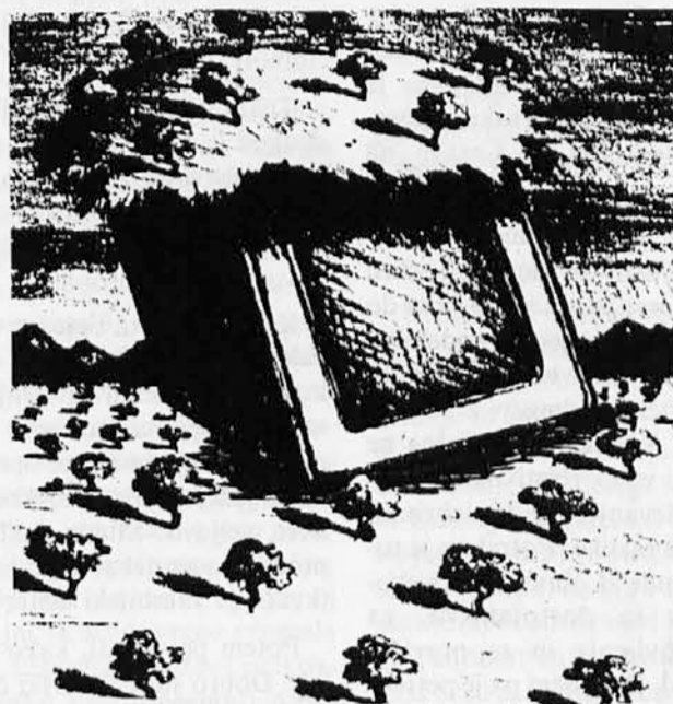
V takem stanju je obljubljen slovenska televizija za primorske Slovence. Dolga je pot od obljub do njihove izpolnitve. Koliko naj jim še verjamemo?

Rai-a povedali, da je ustanova brez denarja, da je podpisala neugodno pogodbo z vlado (ali je bila prisiljena?), da ni na razpolago frekvenc in da je predrago si zamisliti posebne oddajnike za manjšinsko televizijo, saj bi jih rabili manj kot eno uro na dan. Svoje je pristavil še glavni tajnik časnikarskega sindikata, ki se je izkazal z velikim razumevanjem za težave in stiske podjetja. Pravi kup nesreč torej, in človek bi se skoraj zjokal skupaj z nastopajočimi, da ni završalo med prisotnim občinstvom. Ljudje so namreč prišli v dobri veri poslušati, kaj nam Rai po skoraj 20-letnem čakalju pripravlja na TV zaslonih, in so bili razočarani. To še posebej, ko so slišali nastope predstavnikov iz Celovca, Kopra in Bocna, ki se vsi lahko pohvalijo z že obstoječimi manjšinskimi TV oddajami. Zlasti prepričljiva sta bila v utemeljevanju manjšinske TV italijanski in avstrijski predstavnik iz Bocna, ki sta se daleč odmaknila od stališč vsedržavnega vodstva, kakor tudi od stališč vodstva tržaškega sedeža. V Trstu, pa tudi drugod v deželi F-Jk očitno še prevladujejo politične, volilne skrbi. Zato pa naj slovenske TV oddaje sežejo do Gorice in nikakor ne do Benečije, Režije ali v Kanalsko dolino, po možnosti naj se zakamuflirajo v kakšno TV Koper-Capod..., predvsem pa naj stanejo malo, da ne bo treba nastavljati novih ljudi. Kaj novih, težn-