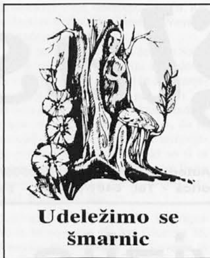
Udeležimo se šmarnic

Danes imamo Cerkev in kristjani ugodno priložnost, da zapolnimo praznino, ki se je ustvarila po padcu