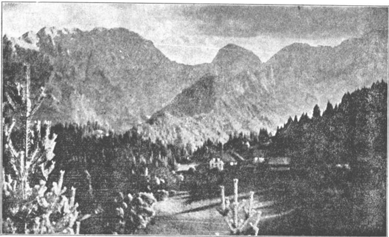
Pogled na Kamniške planine