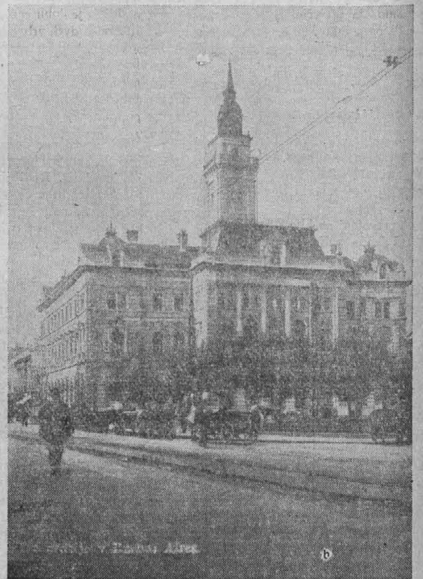
Novi Sad, trgovsko mesto