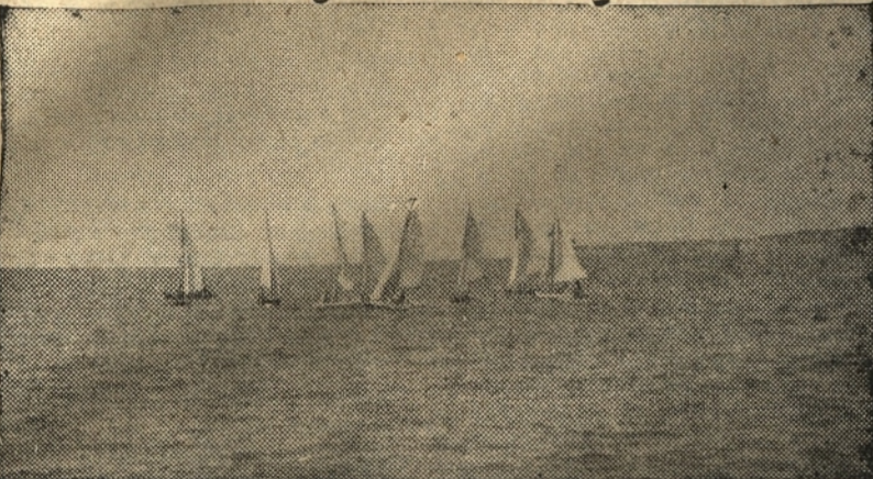
OB POLETNI VOZNI JE KAJ PRIJETNA VOZNA Z JADRNICAMI

bi moral Pirančane poučiti, da tega ne zahtevajo. Dalje: leto plačo v znesku 600 malih denarjev tudi niso mogli dobiti Pirančanov. Pomislimo, da je imel Dubrovnik knez samo 500 denarjev letne plače. In Dubrovnik je bil v tej dobi mnogo večji in močnejši od našega Pirana. Poleg letne plače pa so morali Pirančani prekratiti stanovanje za županovo družino, travnike za njegove konje in končno srbeti tudi za hlape. Vse to pa je obutben trošek, ki je predstavljal za tedanja občinsko blagajno veliko breme. Vsekakor večje breme, kot so pa