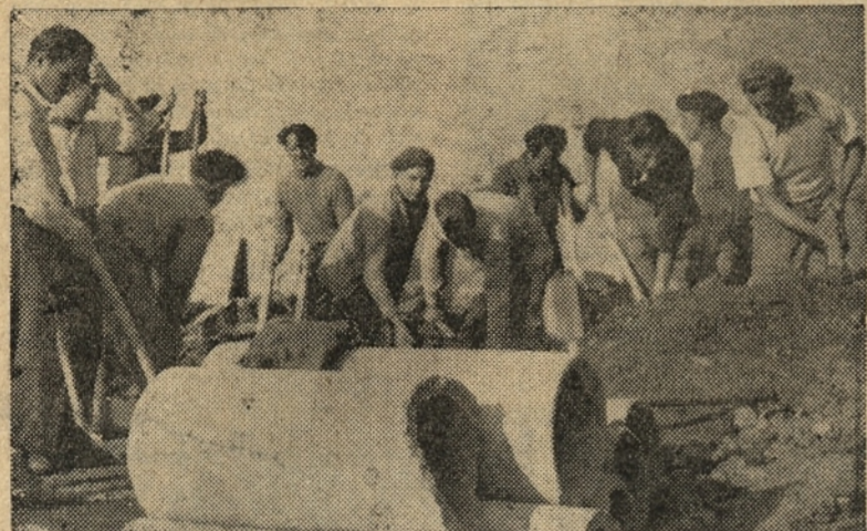
EDILITOVCI IZDELUJEJO TUDI BETONSKE CEVI ZA VODOVODE

V diskusiji se je najprej oglasil Rajner, ki je govoril o vprašanju va- jencev. Med drugim je dejal, da njih plače se niso pravilno urejene. Neka-