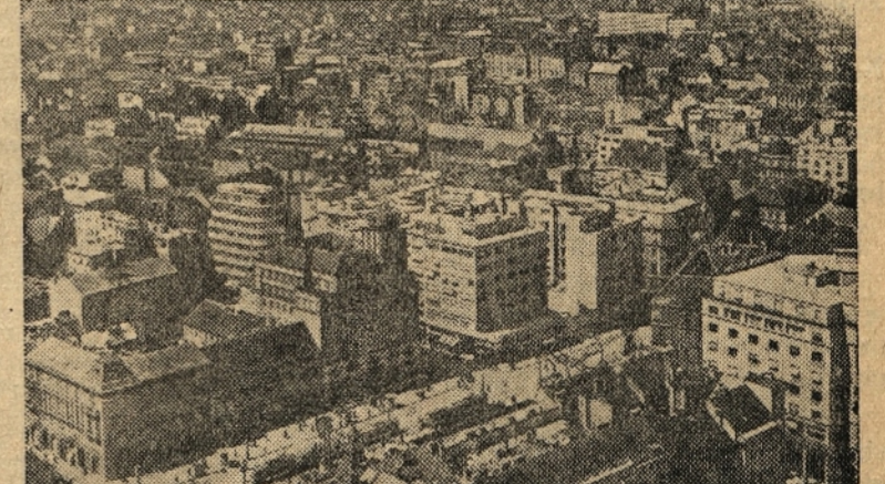
V SREDISCU ZAGREBA

Res, mnogo lepega vidiš v Grazu in po vsej Avstriji. Toda, ko pogledaš spoznaš, kako živni velika večina avstrijskega ljudstva, si zaželiš, da bi bil čimprej doma. Res je, da v našem okrožju ni najrazličnejših dobrot Marshalovega plana, toda v nas vseh je globoka zvest, da bodo tudi naše izložbe nekoč prebogate s predmeti našega plana. Toda, kaj si hočejo pomagati Avstrijci! Avdija, ki je še vedno okupirana dežela in kot je prišel pred nedavnim glas iz Panza, se Avstrijci ne bodo še tako kmalu otresli okupacije.