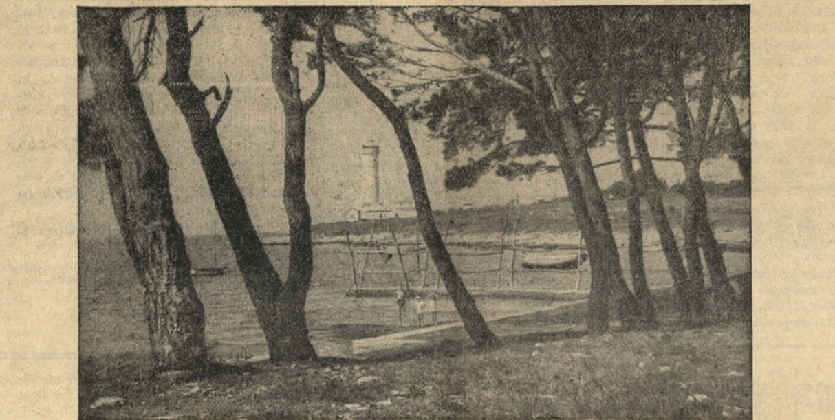
IZLETNIŠKA TOČKA V SAVUDRIJI

Teritorialno in notranje morje spadata popolnoma pod suverenost obalne države. Vse ladje so podrejene njenim