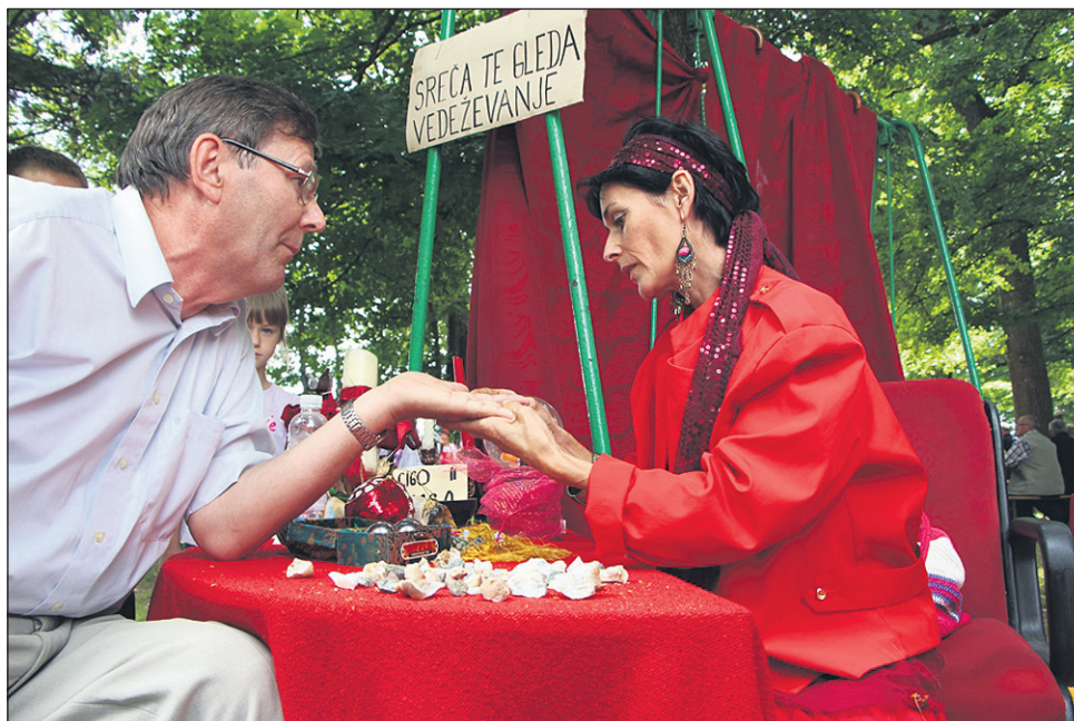
Šlogarja je brala z dlani in napovedovala prihodnost.

ognjičevo mazilo ter mazilo iz rumene in bele lakote, ki je še posebej zdravilno.