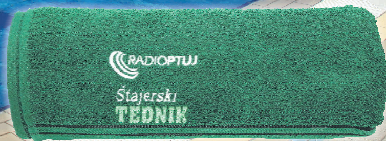
* slika je simbolična

Po lanski uspešno zaključeni akciji, v kateri smo iskali naj medicinsko sestro/medicinskega tehnika, smo se letos ponovno odločili pripraviti akcijo poletja, le da bomo tokrat izbirali