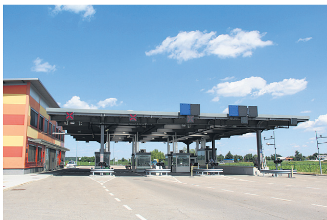
Gneče na MMP Središče ob našem obisku ni bilo.