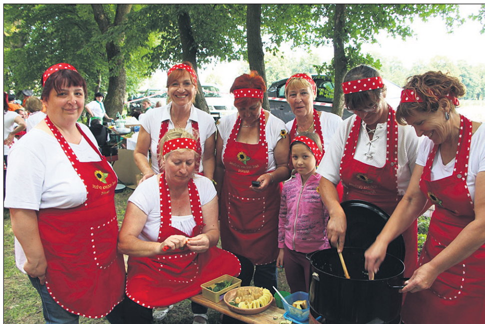
Nagrado za najlepše urejen tekmovalni prostor je prejelo Društvo kmečkih žena občine Dornava.