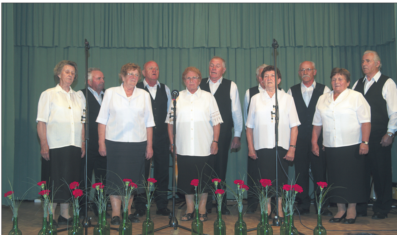
Ob prazniku so zapele tudi ljudske pevke in ljudski pevci.