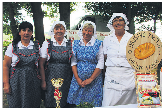
Najboljši krompir so, po oceni komisije, pripravile članice Društva kmetic občine Videm. Njihov moto je bil: »Čim bolj ajnfoh, tem boljše.«