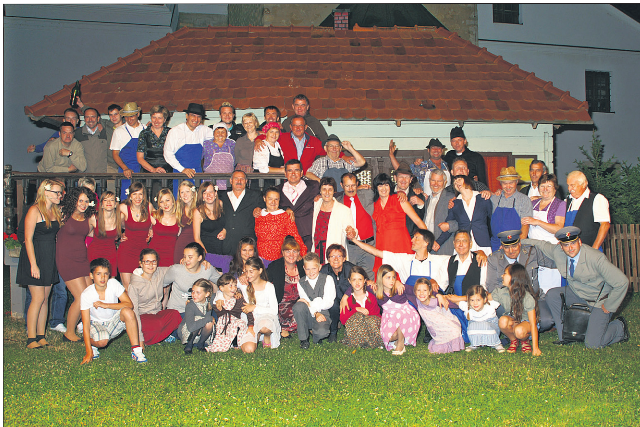
Sodelujoči pri predstavi Jesenska poroka 3

Kosta, Micikina mladostniška ljubezen, se po več desetletjih vrne iz ruskih povojnih zaporov. Miciko je zapustil že v mladosti, vendar mu tega ni nikoli odpustila. Kljub vsemu se ji zdi, da ga ima še vedno rada. Predstava Jesenska poroka 3 je napeta, polna čustev, kljub resni življenjski vsebini izjemno zabavna in šaljiva, za kar poskrbijo drugi nastopajoči, predvsem gostilničar Lojz, vaški posebnež Viktor in poštar Janko. Slednjemu že na začetku predstave skrijejo poštarstvo obleko, ki jo potem išče skozi celotno zgodbo. Medtem se kar šestkrat preobleče v različne kostume, kar je še posebej zabavno. Iskanje poštarjeve pogrešane obleke osrednjo zgodbo o Potratnikovi Miciki večkrat obrne v povsem nepričakovano smer. Veliko smeha prinaša tudi sporočilo, ki ga o Kosti prinese policijski komandir. Preden sporočilo pride do osebe, ki ji je namenjeno, dobi povsem novo vsebino. In sporočilo v spremenjeni obliki ponovno pomeni pre-