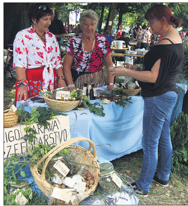
Zeliščarke so na svoji stojnici ponujale pestro paleto izdelkov.

Slednji nam je povedal, da so pri ocenjevanju kot prvo in glavno merilo upoštevali okus, kako je bil krompir pripravljen, da je bil lepohlajen in narezan ter da ni bil zmečkan. Upoštevali so tudi vsebnost maščobe, se pravi, da krompir ni bil premasten. »Člani komisije smo bili enotnega mnenja, da je bil krompir vseh ekip zelo dobro pripravljen in da smo imeli težko delo pri odločitvi. Še posebej težka odločitev je