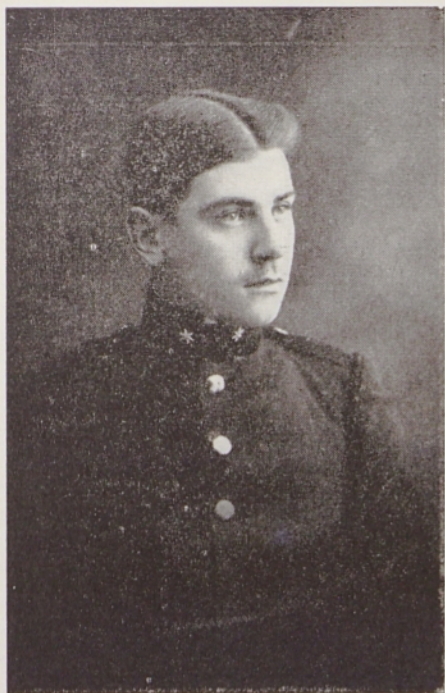
Stanko Gradišnik (slika iz l. 1909), režiser in igralec