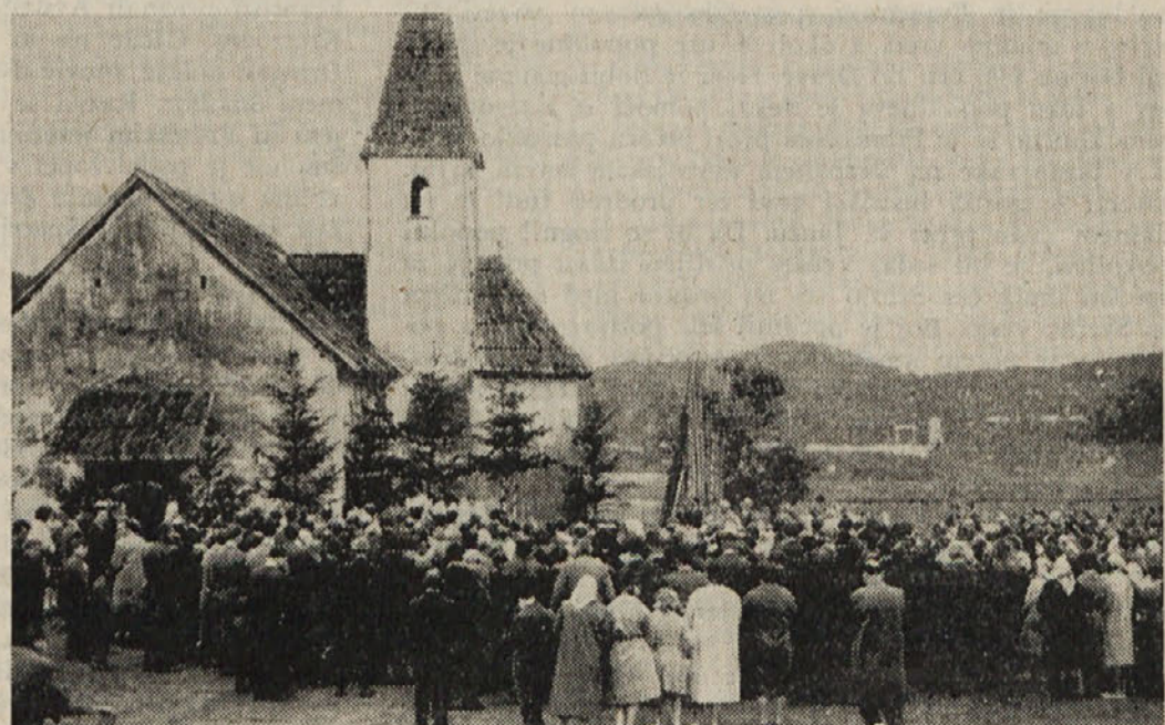
Zadnja služba božja v breški cerkvi