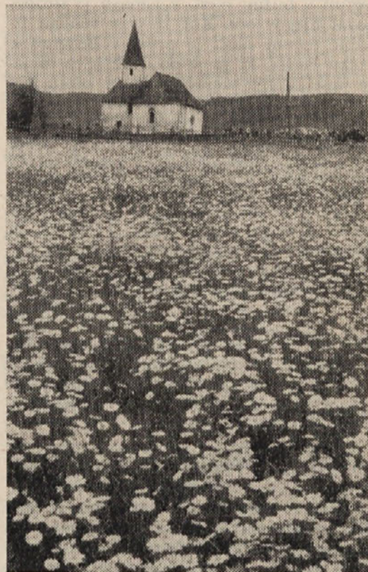
Cerkvico na Brezi bo kmalu zalila voda

bilo prav to nekaj posebnega in zanimivega.