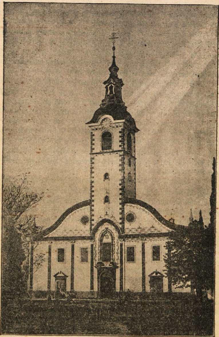
Cerkev Matere Božje na Tersatu.