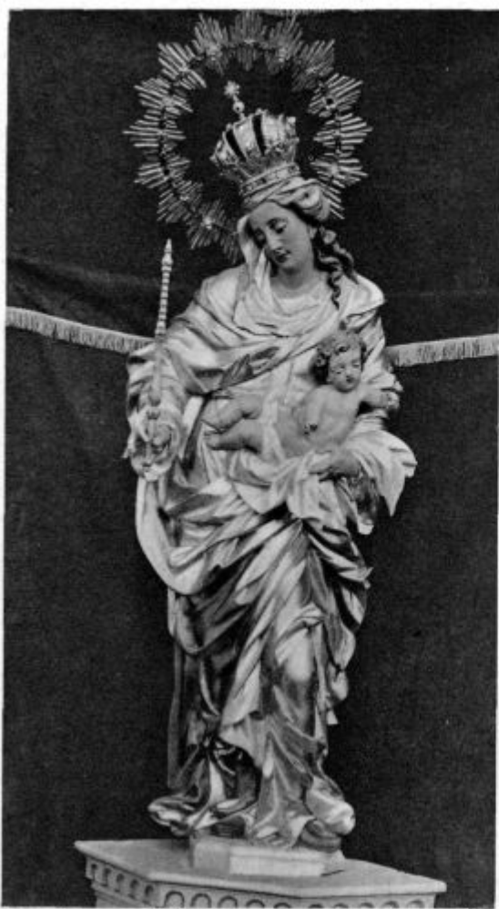
cerkev v Stari Loki