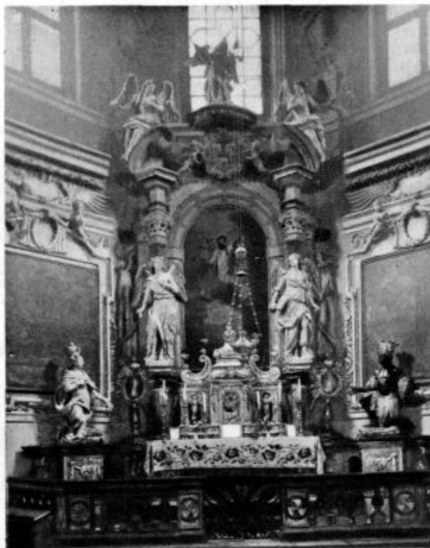
Sv. Jakob v Ljubljani

»Jaz sem sadil, Apolo — bil je Pavlov pomočnik — je zalival, Bog pa je rast dajal. Zatorej ni nič, kateri sadi in nič, kateri zaliva, ampak, kateri daje rast, Bog. Kateri pa sadi in kateri zaliva, sta eno — obojih delo ima enako vrednost, ker oba Bogu služita — vsak pa bo prejel svoje plačilo po svojem delu. Kajti božji sodelavci smo, vi pa ste božja njiva, božja zgradba.«