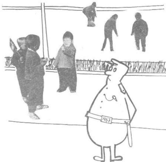
Za otroško varstvo je v Siski preskrbljeno