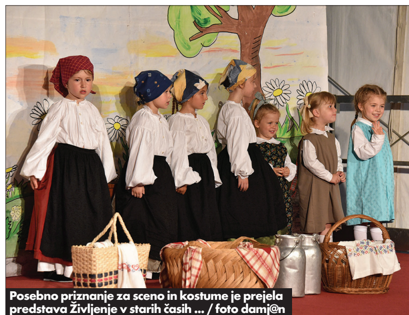
Posebno priznanje za sceno in kostume je prejela predstava Življenje v starih časih ...

starih časih med Trstom in Krasom. Zmagovalci so prejeli grafiko z naslovom Odprta