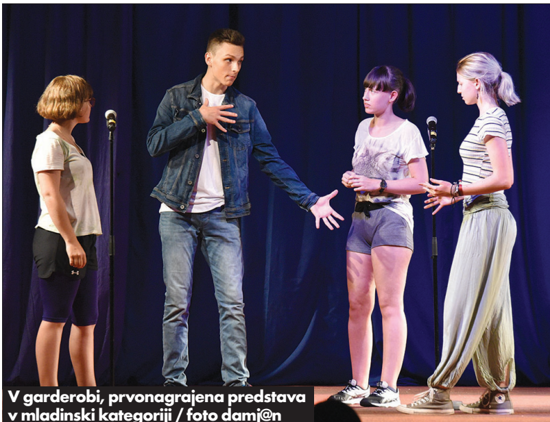
V garderobi, prvonagrajena predstava v mladinski kategoriji