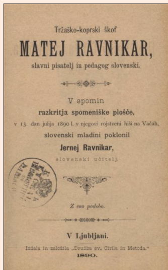
Knjižica, izdana v spomin na razkritje spominske plošče pokojnemu tržaškemu škofu Matevžu Ravnikarju na rojstni hiši na Vačah leta 1890.