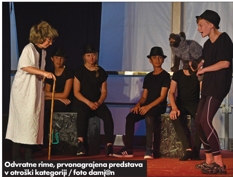
Odvratne rime, prvonagrajena predstava v otroški kategoriji

pajoči je dobil možnost, da se izkaže, in to ne samo na igralškem področju. Igra so namreč bogatili tudi petje in prijetne koreografije. Treba je poudariti prisotnost glasbenikov, ki so igrali v živo". V kategoriji mladinskih skupin so se za nagrade potegovala tri skupine: 1. nagrado je