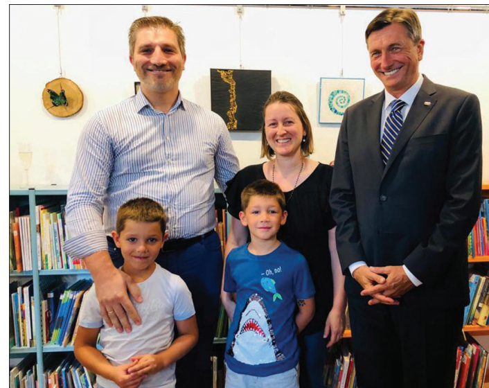
Na proslavi so bili prisotni tudi najmlajši predstavniki naše narodne skupnosti, ki so se ponosno slikali s predsednikom