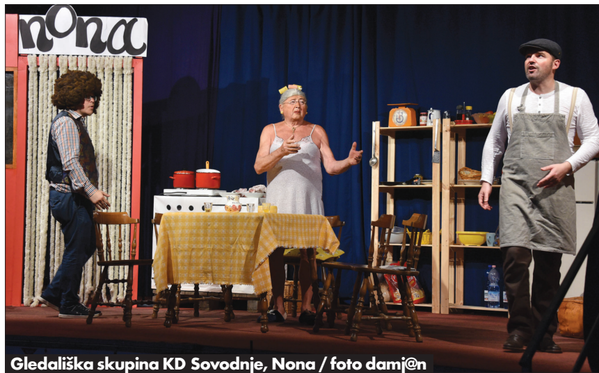
Gledališka skupina KD Sovodnje, Nona