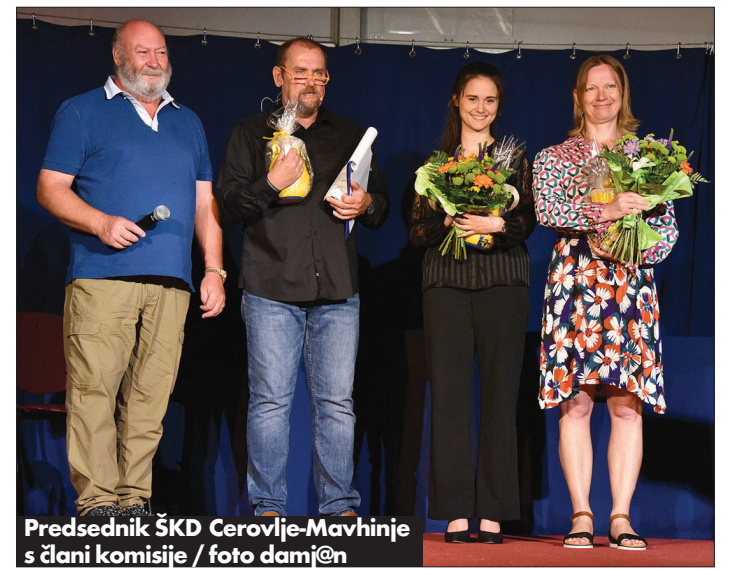
Predsednik ŠKD Cerovlje-Mavhinje s člani komisije

lalan, gledališki in filmski igralec, pevec, voditelj raznih oddaj, mentor in pedagog na raznih gledaliških in lutkovnih delavnicah, zadnji dve leti umetniški koordinator Slovenskega stalnega gledališča Trst, od prvega julija za tri leta pa direktor SSG. Malalan živi in dela razpet med Trstom, Ljubljano in Krasom. Sodeloval je z marsikaterim gledališčem in pri tem oblikoval že več kot 70 gledaliških vlog; tudi filmsko platno mu ni tuje. Kot pevec je nastopil na več glasbenih festivalih. Redno sodeluje z raznimi televizijskimi in radijskimi postajami. Prejel