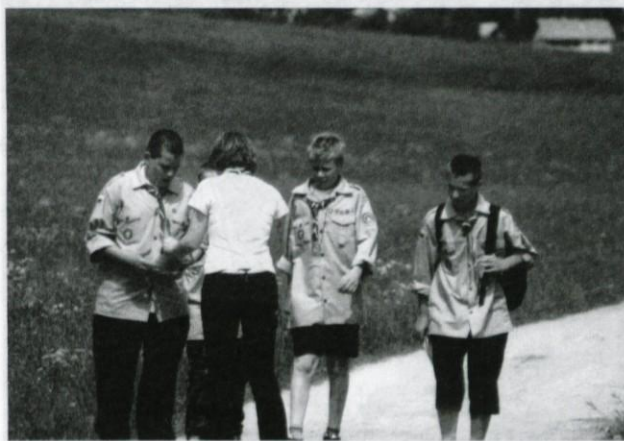
Na eni od kontrolnih točk.

Že jutro je napovedovalo lep dan. S polurno zamudo, ki je že tradicionalna in nepremostljiva, smo začeli tekmovanje s polno paro. Kurjenje ognjev, signalizacija, premagovanje ovir, signalni stolp... Prijavilo se je 18 ekip najmlajših članov (medvedki in čebelice), ki so bili razdeljeni v štiri kategorije, in 6 ekip tabornikov od 5. do 8. razreda (gozdovniki in gozdovnice), razdeljenih v dve starostni kategoriji.