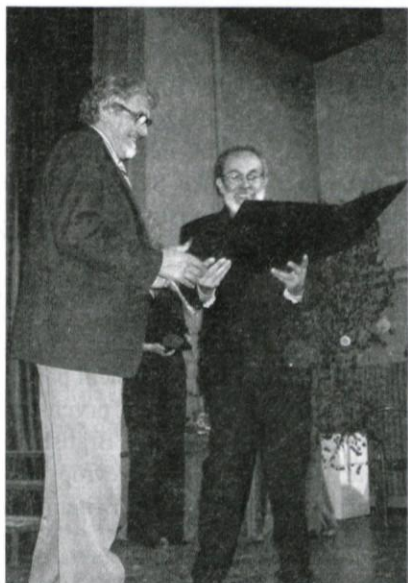
Marcelu Štefančiču Linhartova plaketa.

Nevenka Malavašič, besedilo pa je pripravil Marcel Štefančič.