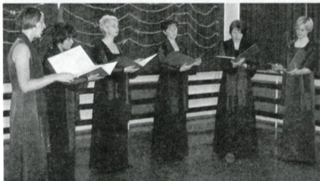
Dekliški sekstet - pač, za odlično.