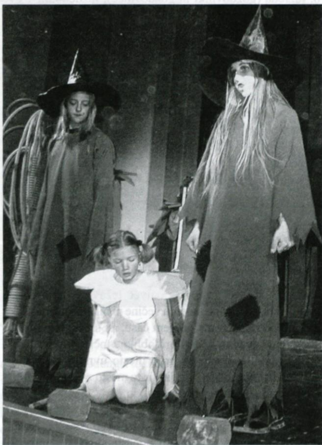
Čarovnice niso vselej hudobne.

Osnovna šola Tabor se je že na otroškem gledališkem maratonu predstavila z uprizoritvijo Male čarovnice, ki ni znala biti zlobna in Kdo bo koga. Učenci in njihovi mentorji pa so obe predstavi ponovili sredi maja v Narodnem domu za starše in svoje prijatelje.