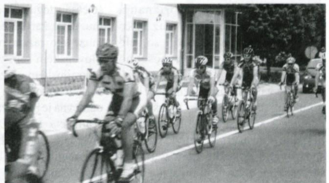
Logaški kolesarski "oddih" pred zahtevnim vzponom.

Deseti slovenski tour je nekako obližnil tudi Logatec. Kolesarji z desete dirke po Sloveniji so 9. maja pripeljali z Vrhnike, kjer so načeli slovito kraljevsko etapo, skozi logaški drevored.