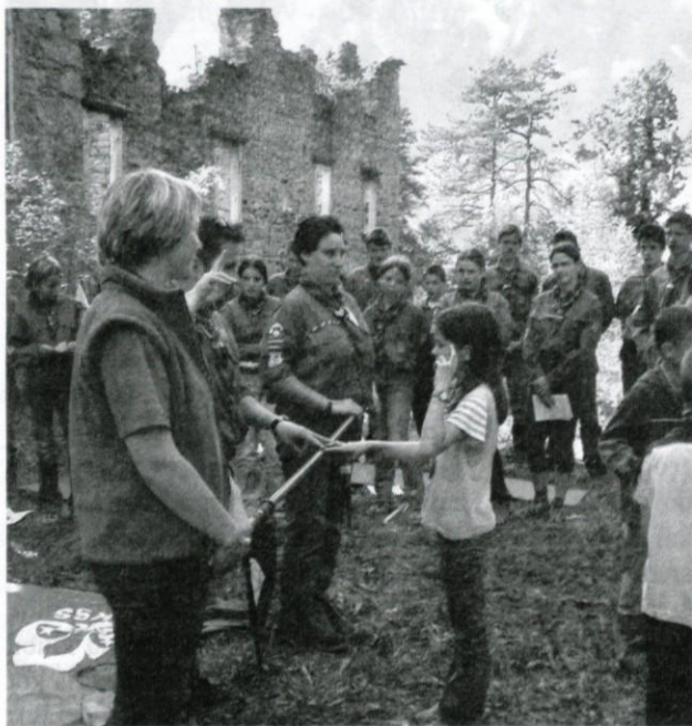
Skavti so se zaobljubili.

Skavtsko obljubo poznajo vsi skavti na svetu. Slovenski skavti so vključeni v Zvezo Slovenskih katoliških skavtinj in skavtov (ZSKSS) ter v Zvezo bratovščin odraslih katoliških skavtov in skavtinj Slovenije (ZBOKSS). Obljubo izrečejo ob začetku svoje skavtske poti, ki jo spoznavajo kot novinci-najmlajši v volčjem krdelu, malo večji v četi, srednješolci v noviciatu in študenti v klanu, odrasli pa v bratovščini.