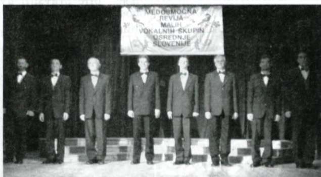
Logaški osmerek bo jeseni pel na državni reviji.