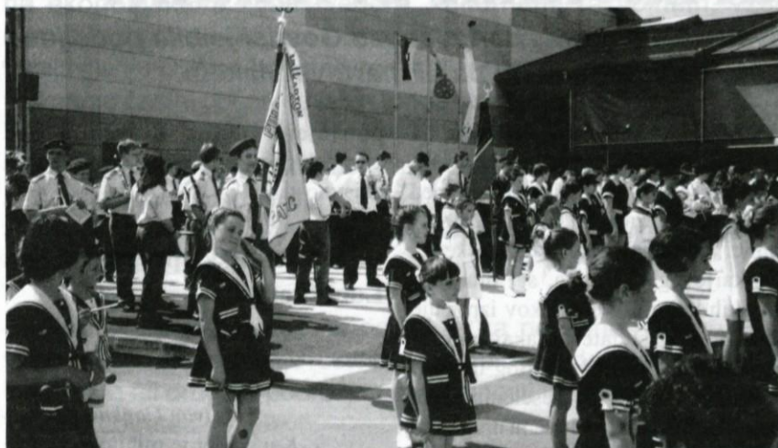
Srečanje godb in mažoret.