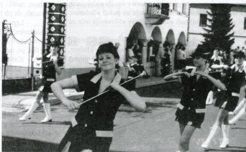
Med eleganco in gracioznostjo.

Najbolje so se odrezale Logatčanke, saj so v vseh treh disciplinah osvojile največ medalj in pokalov. V twirling