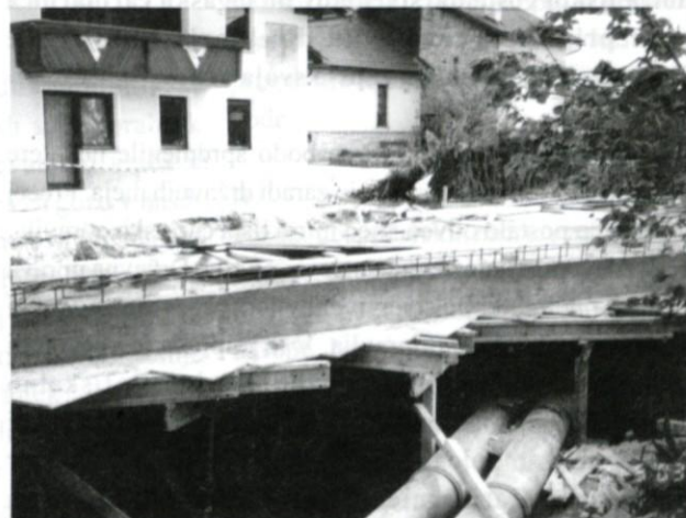
Most čez Logašnico.

Grčarevec. Seveda, manj denarja pa bo za druge ceste. Odprto bo ostalo vprašanje mrliške vežice, grajskega kompleksa, stare sodnije in Tabora – posebej glede zimске službe.«