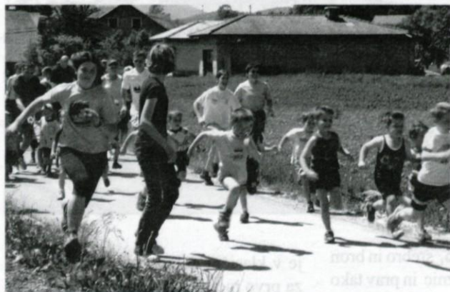
Le kdo bo najhitrejši?