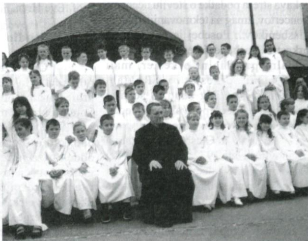
V župniji sv. Nikolaja je bilo 57 prvoobhajancev.

In koliko se jih je z Jezusom prvič združilo po posameznih župnijah?