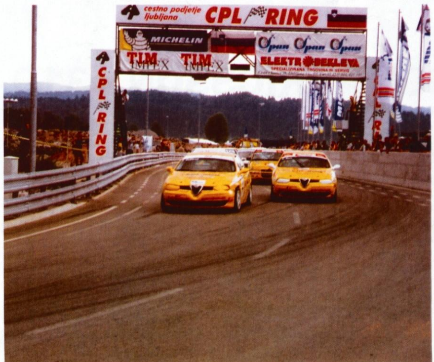
gur Ogorčeni spopad med Alfami.

Kakorkoli, dirkališče v Zapolju kar opazno promovira Logatec, tudi če je gledalcev manj od pričakovanih. Časopisni stolpci se pa le na široko polnijo.