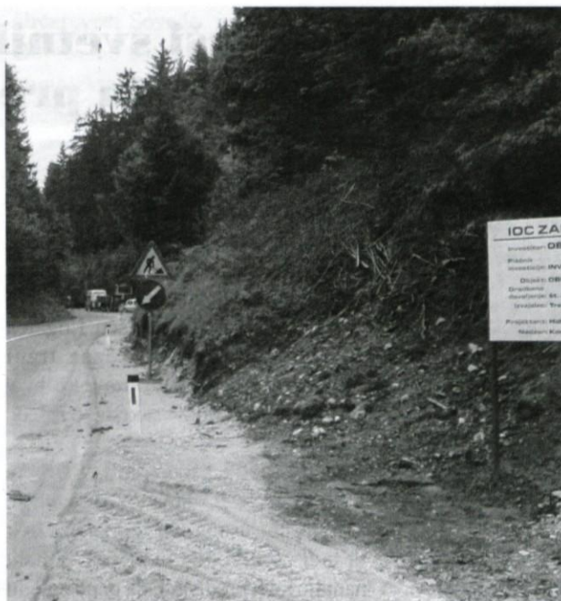
Novi vodovod iz Turkove grape obroblja na novo tudi cesto proti Rovtam.