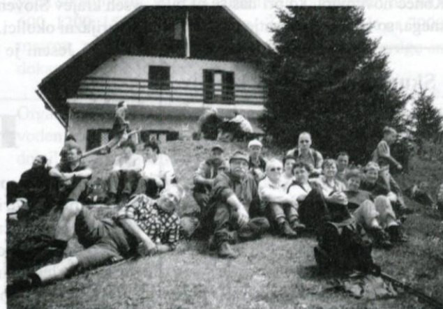
Počitek pred kočjo na Blegošu.

Razgled z vrha ni bil ravno kaj prida, zato so se planinci kaj kmalu spustili spet do koč, kjer so se odpočili in okrepcali. Nato so prisostvovali slovesnosti, ki jo je pripravilo Planinsko društvo iz Gorenje vasi. Prijetno je bilo tudi v klepetu s prijatelji in znanci.