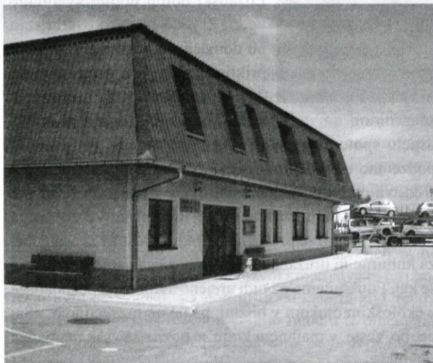
Carinarnica še, a ne za dolgo.

Z gledišča razlagalca bi predvidenim spremembam težko oporekali. Manjše izpostave se bodo ukinile ali (in) se prevrednotile v carinska skladišča. Logaška je med najmanjšimi, saj ima v celotnem obsegu dela le 1,6-odstotni delež. Poleg logaške bo ukinjena tudi škofjeloška, ki ima