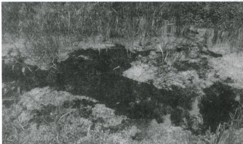
Tudi mokriščem naj velja naša skrb.

Zavod za gozdove Slovenije, OE Ljubljana