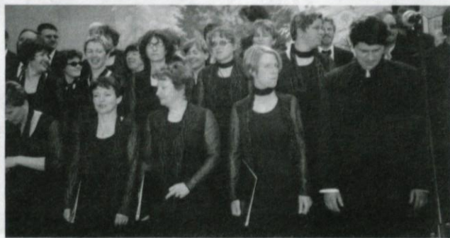
Pevke Tabora v "objemu" pevcev iz Loparja.