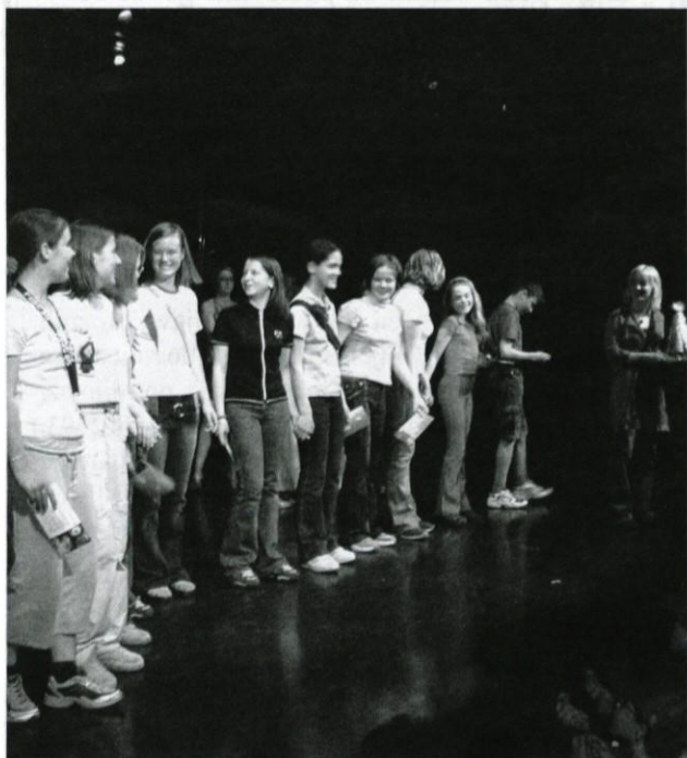
Tudi med najmlajšimi - najboljši.