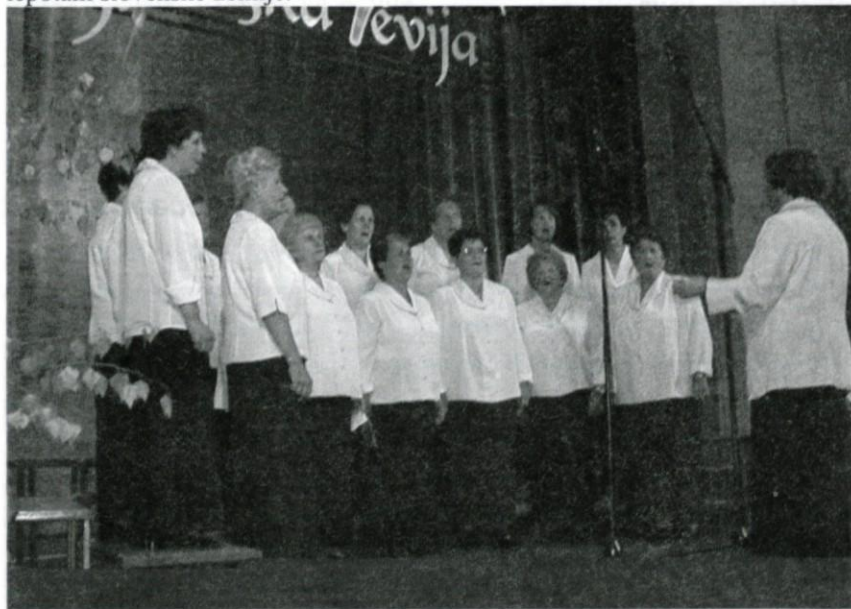
Ženski zbor društva invalidov in upokojevcev.

Celotnega razvoja revijskega prepevanja na Logaškem prav gotovo ni mogoče obelodaniti v kratkem sestanku, je pa zgodovinski razvoj mogoče spremljati v drobni publikaciji »Revijsko prepevanje na Logaškem, 1968 – 2003, ki jo je izdala in založila Območna izpostava Javnega sklada RS za kulturne dejavnosti Logatec, zanjo