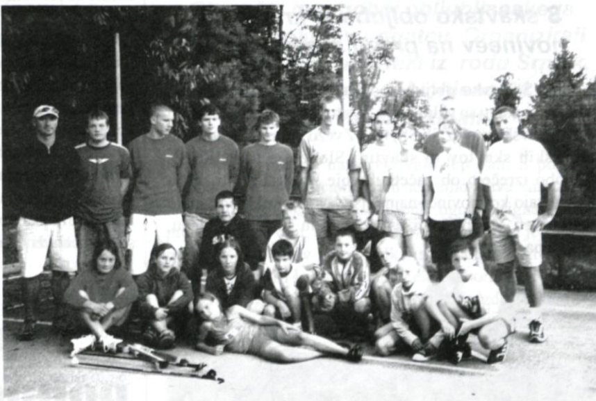
Tekaška mladost sredi velikih uspehov.